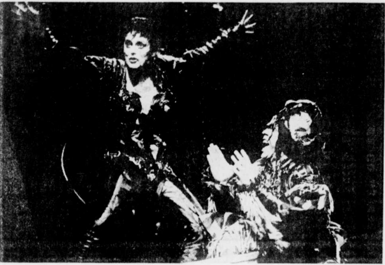
«Le songe d'une nuit d'été», mis en scène par Robert Lepage: un des succès du TNM cette année.