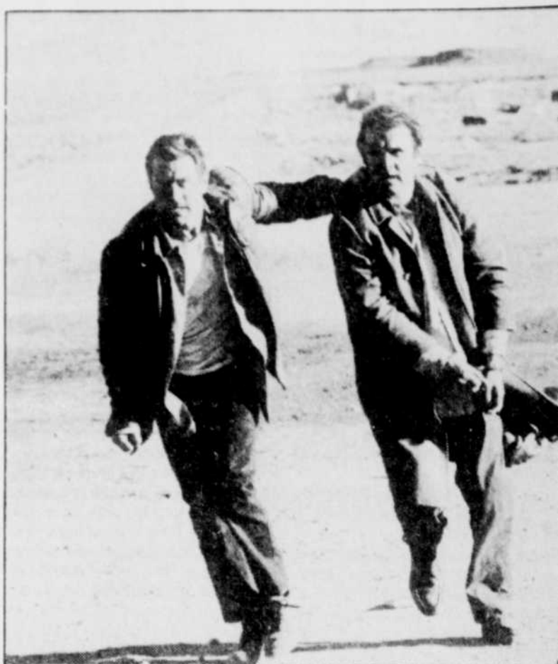
Jack Walsh (Robert de Niro) et John Mardukas (Charles Grodin) en plein désert, fuyant à la fois la pègre et le FBI.

La fin du film vous réserve de l'inattendu, mais quelque chose de charmant. Et pour ne pas gâter la sauce, la musique de blues de Danny Elfman est d'un feeling!