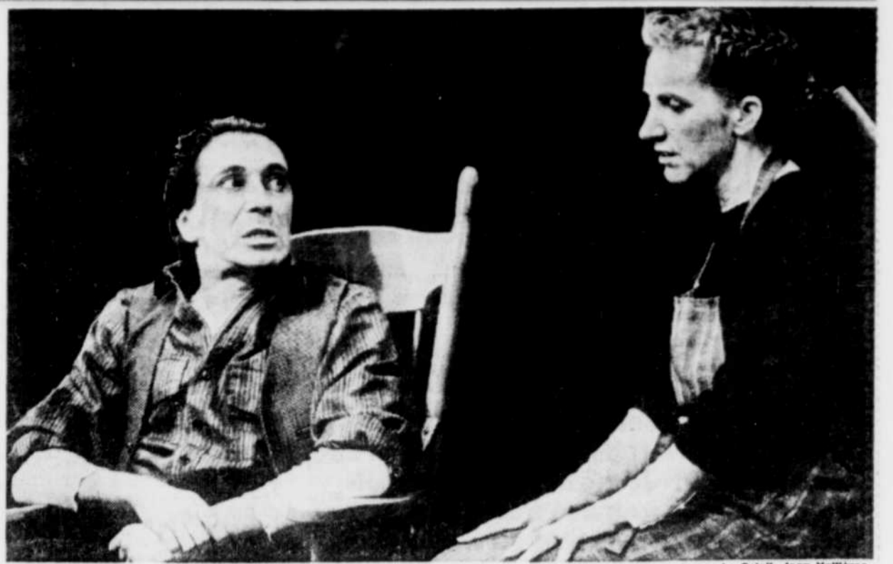
Le Soleil, Jean Vallières

L'ingénieur Leclerc ne regrette pas son égarement dans le théâtre, il a trouvé là un cadre de travail qui intègre comme pas un les dimensions techniques, financières et humaines. On s'exprime plus dans les coulisses du théâtre que de la vie, on ne nie pas l'émotion. ●