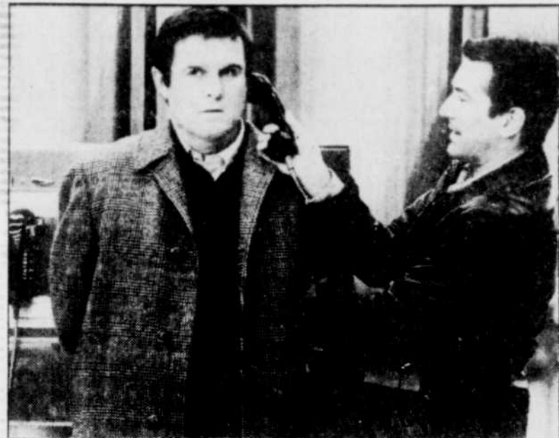
Les deux « héros » du film: Charles Grodin et Robert de Niro