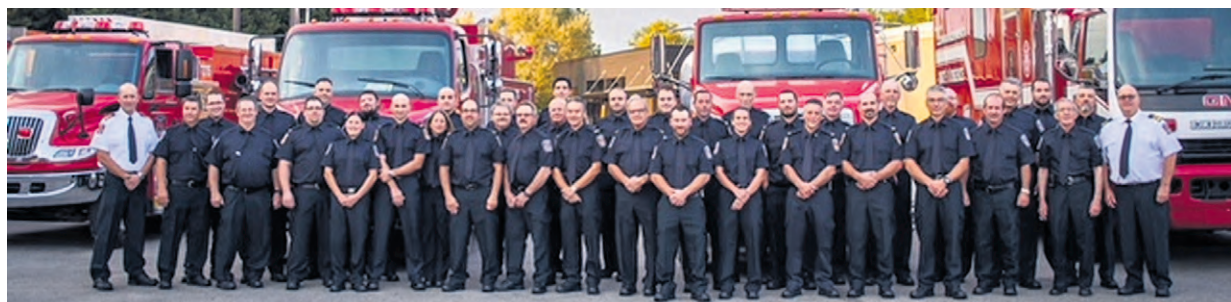
Les octrois vont permettre d'étudier la création de régies intermunicipales dans certains domaines comme la sécurité incendie.