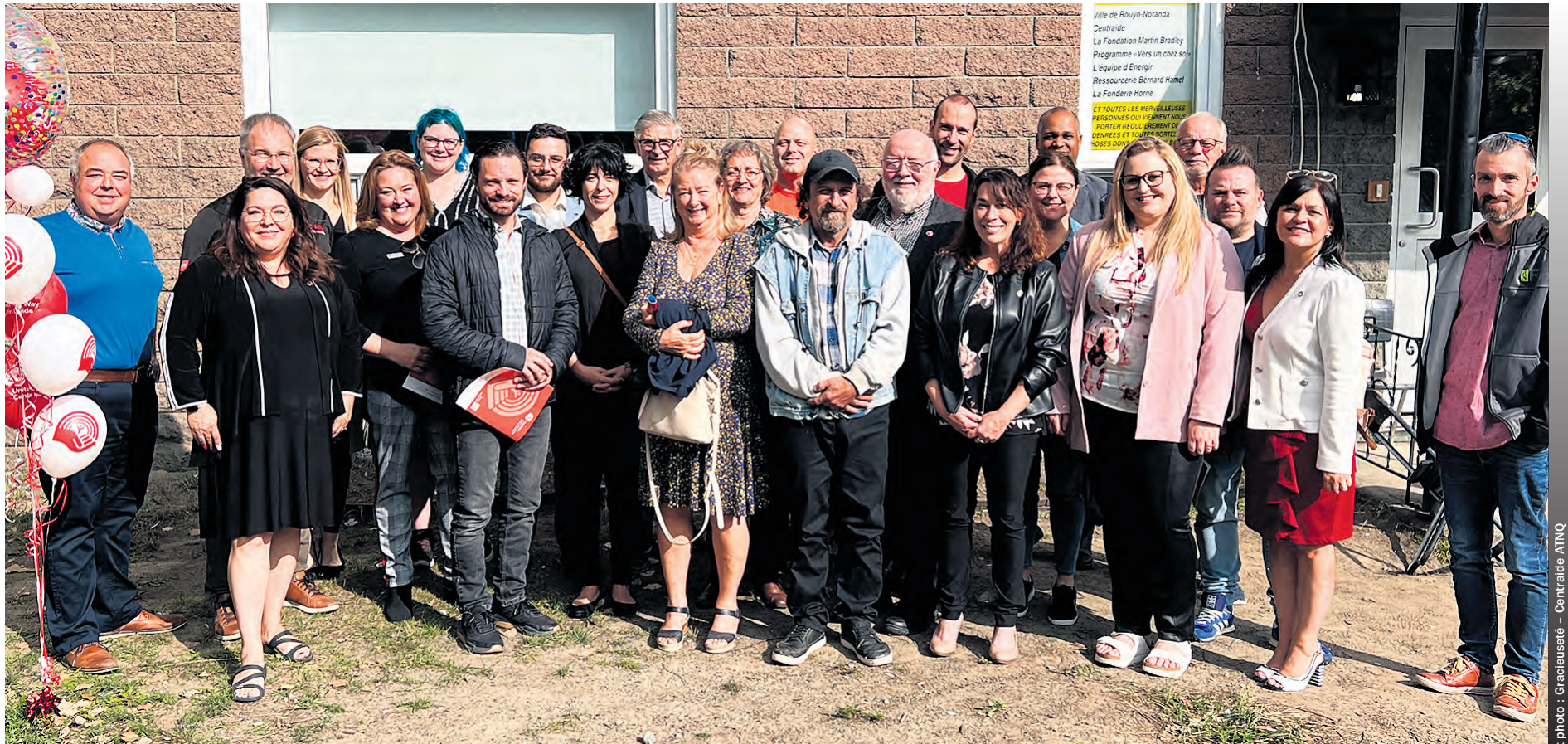
Gens présents lors du coup d'envoi de cette campagne de financement 2023, représentants d'organismes, entreprises et membres du cabinet de campagne.