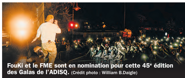
FouKi et le FME sont en nomination pour cette 45 e édition des Galas de l'ADISQ.