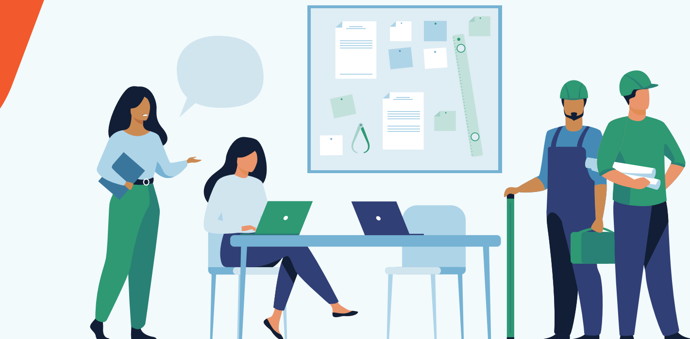
Illustration par pch.vector sur Freepik