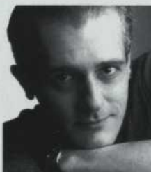
GILL CHAMPAGNE Rochefort Felton