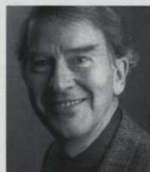
ROLAND LEPAGE Le cardinal de Richelieu D'Artagnan père Tréville