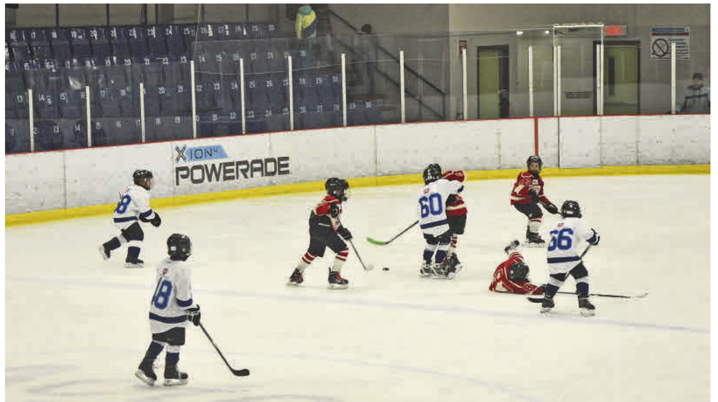
Le Centre sportif d'Acton Vale vibrera au rythme du Tournoi novice, atome et pee-wee d'Acton Vale pendant 14 jours.

Et finalement, les Valois d'Acton Vale Atome A feront les frais de l'ouverture officielle de l'édition 2016 en recevant les Gaulois de Saint-Hyacinthe ce même vendredi, à 19 h.