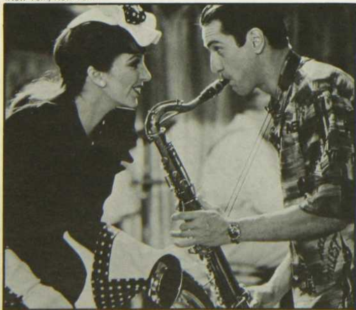
«New York, New York»

Une aimable comédie qui permet à Walter Matthau de se renouveler et à Elaine May de se distinguer.