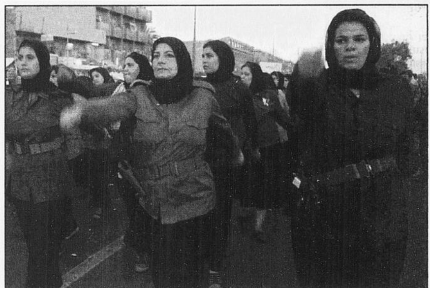
Des femmes militaires irakiennes ont défilé à travers Bagdad hier en guise de soutien au président Saddam Hussein.

Parmi les questions soumises, elles ont demandé une clarification au Vatican sur ce qui constitue une conduite schismatique et sur les passages de la Bible concernant l'égalité des femmes.