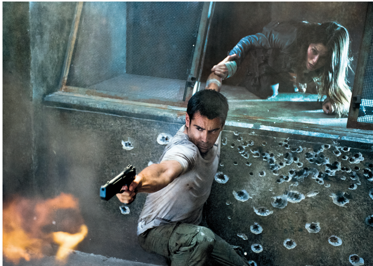
Colin Farrell joue le rôle d'un ouvrier dont la vie a été fabriquée de toutes pièces.