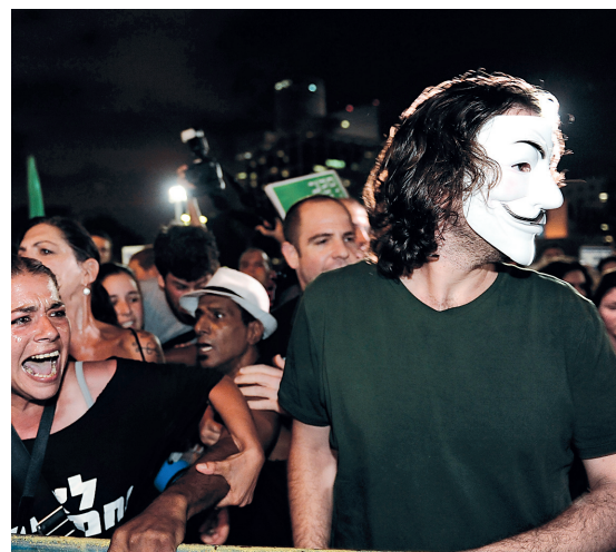
Manifestation hier à Tel-Aviv contre les mesures d'austérité du gouvernement israélien