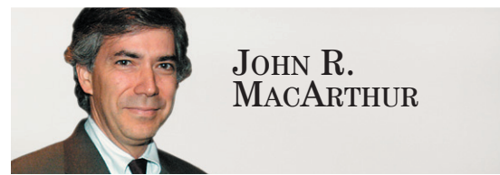
JOHN R. MACARTHUR

Normalement, j'impute les sottises déclarations des politiciens à des motifs tactiques. L'emploi du «n'importe quoi» sert souvent à tromper des électeurs trop indifférents ou ignorants pour reconnaître la bêtise qui leur passe sous le nez; ce sont surtout les politiciens qui en profitent aux urnes.