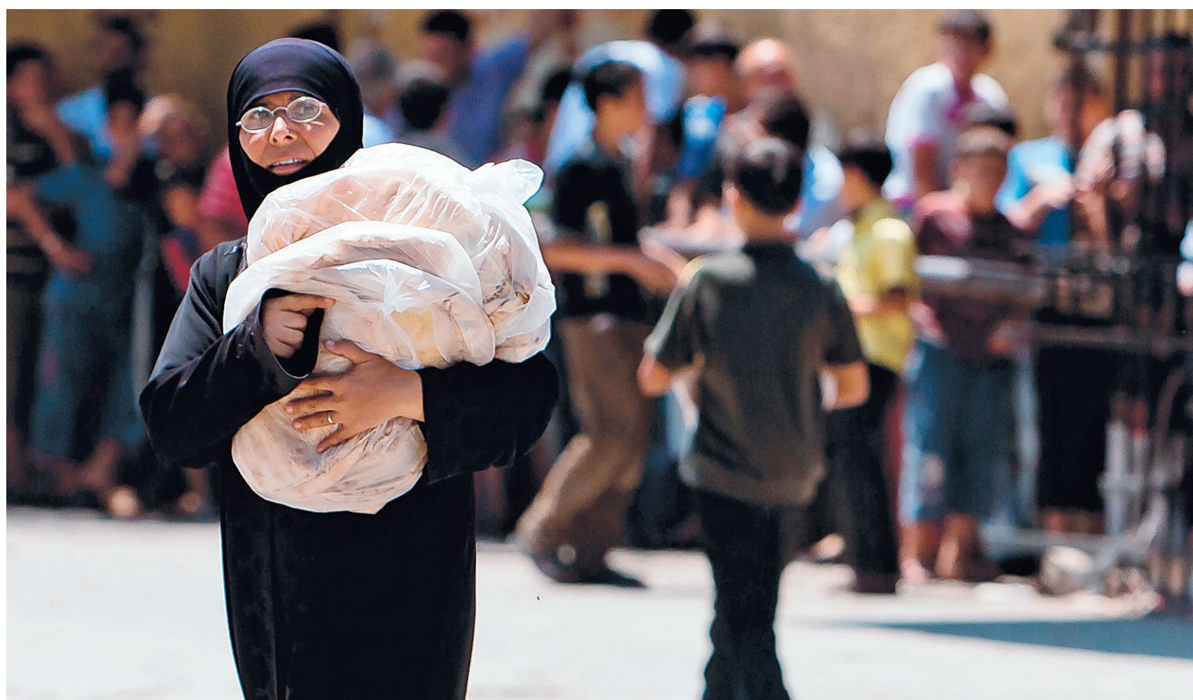
Syrienne avec sa provision de pain ce week-end à Alep, poumon économique de la Syrie.