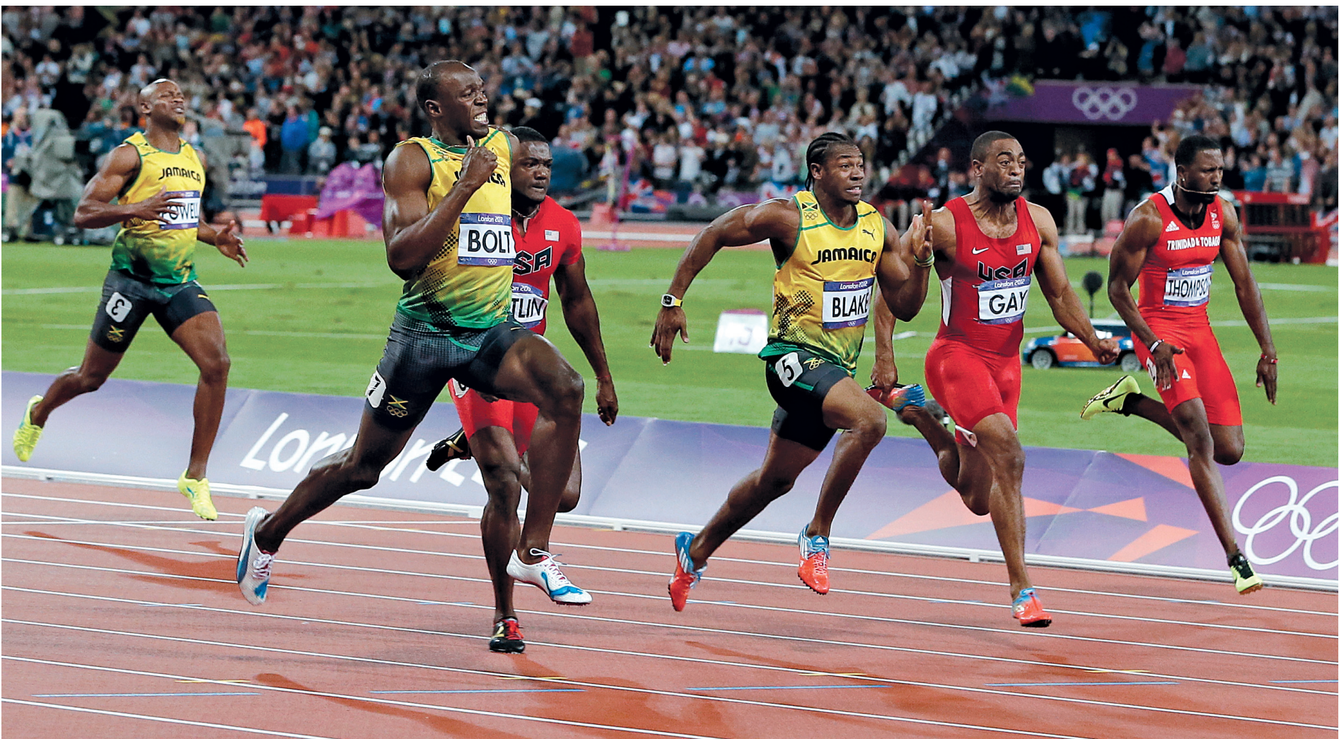
Usain Bolt assure avoir « fait un pas de plus vers la légende », après avoir rejoint l'Américain Carl Lewis dans l'histoire en conservant sa couronne olympique sur 100m, hier à Londres, avec le deuxième meilleur chrono de tous les temps.