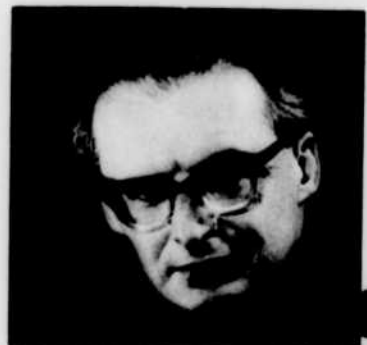
Franz Paul DECKER dirige l'Orchestre symphonique de Montréal à 20 h 30.