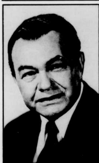
Edward G. ROBINSON est l'ame des vedettes du film «Le Souffle de la violence», présenté à 23 h 40 à CBOFT.