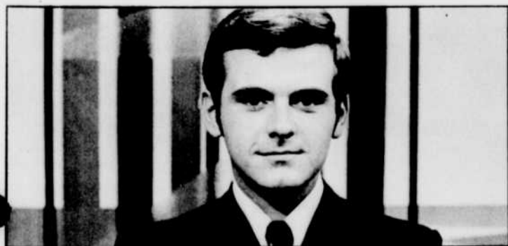
Pierre LALONDE est l'animateur-vedette «A guichet fermé», 19 h 30.