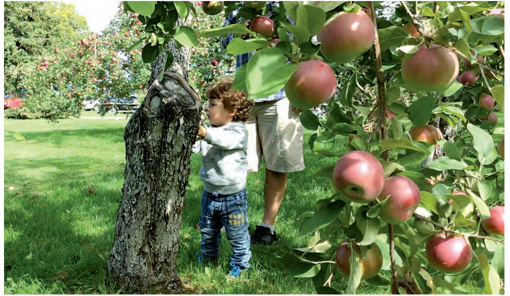
L'histoire de la pomme remonte à environ 7000 ans.

La pomme poursuivra sa route en même temps que les immigrants européens qui colonisèrent l'Amérique du Nord, notamment la Nouvelle-France. À quelle date pouvons-nous situer l'apparition du premier pommier dans les colonies françaises d'Amérique ? En 1610 à Port-Royal ou à Québec en 1617 avec Louis Hébert ?