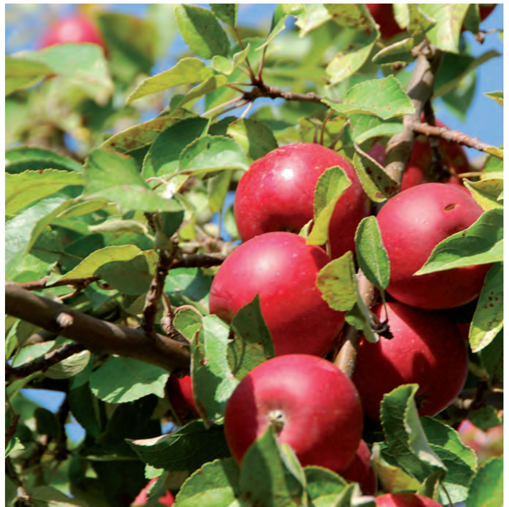
Pour Éric Rochon, la pomme est « un aliment iconique, de fierté nationale, et seul fruit québécois disponible à l'année. »

Bas de vignette : pour Éric Rochon, la pomme est « un aliment iconique, de fierté nationale, et seul fruit québécois disponible à l'année. »