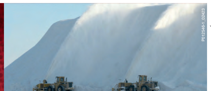
SERVICE DE DÉNEIGEMENT