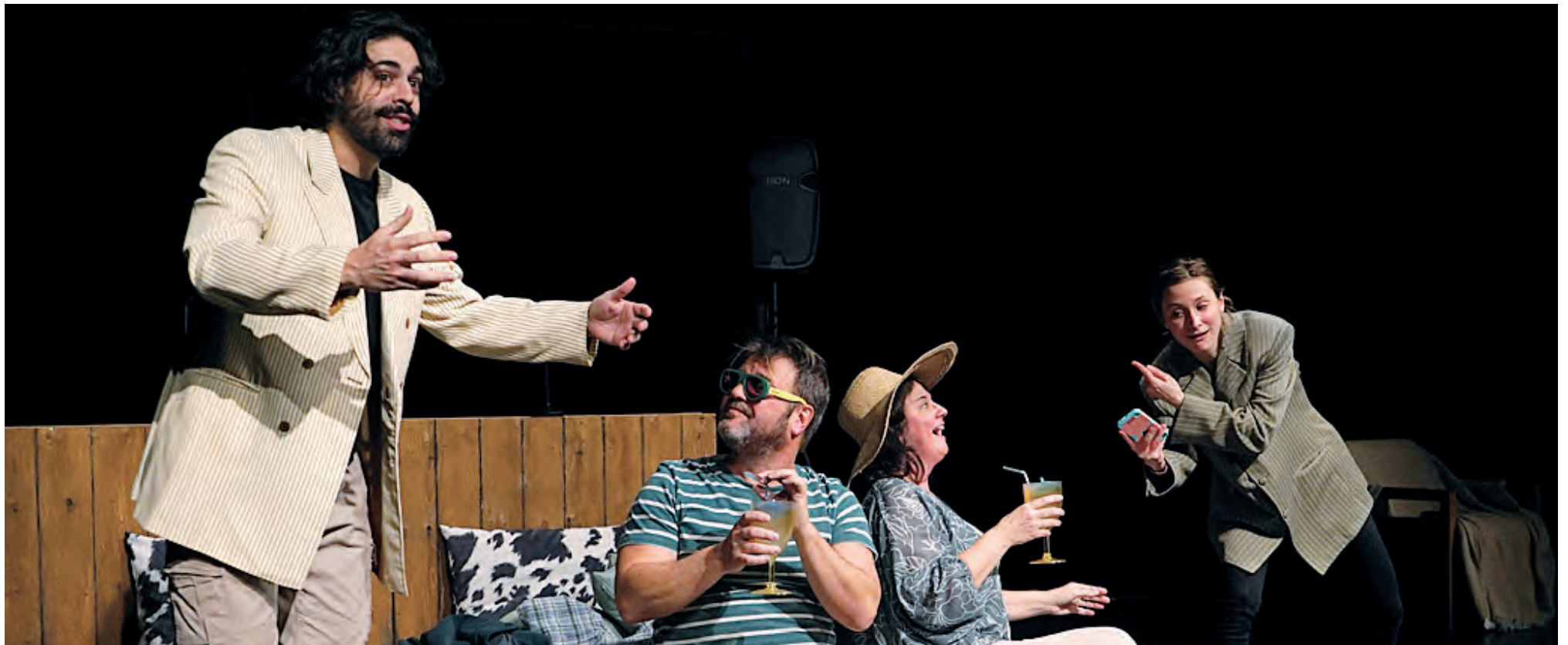
Rouge, jaune, vert, une pièce théâtrale dramatique, mais parfois comique.