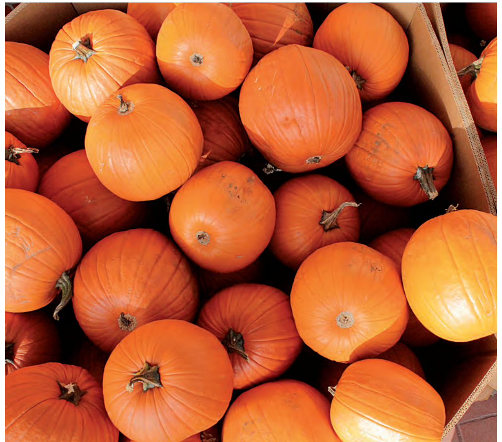
La citrouille, symbole d'Halloween, une fête d'origine celte et chrétienne.

Le rite entourant la création de lanternes à partir de légumes-racines est soutenu par la légende irlandaise de Jack O'Lantern. Ce récit raconte le destin de Stingy Jack, un ivrogne ayant pactisé avec le Diable à plusieurs reprises et qui, à la fin de sa vie, s'est vu refuser l'entrée autant en enfer qu'au paradis. Condamné à errer dans l'entre-deux-mondes, le Diable, ayant pitié de Stingy Jack, lui donna une braise ardente afin qu'il puisse s'éclairer dans son errance sans but. Pour conserver cette lumière, Jack confectionna une lanterne à partir d'un navet dans lequel il mit sa braise.