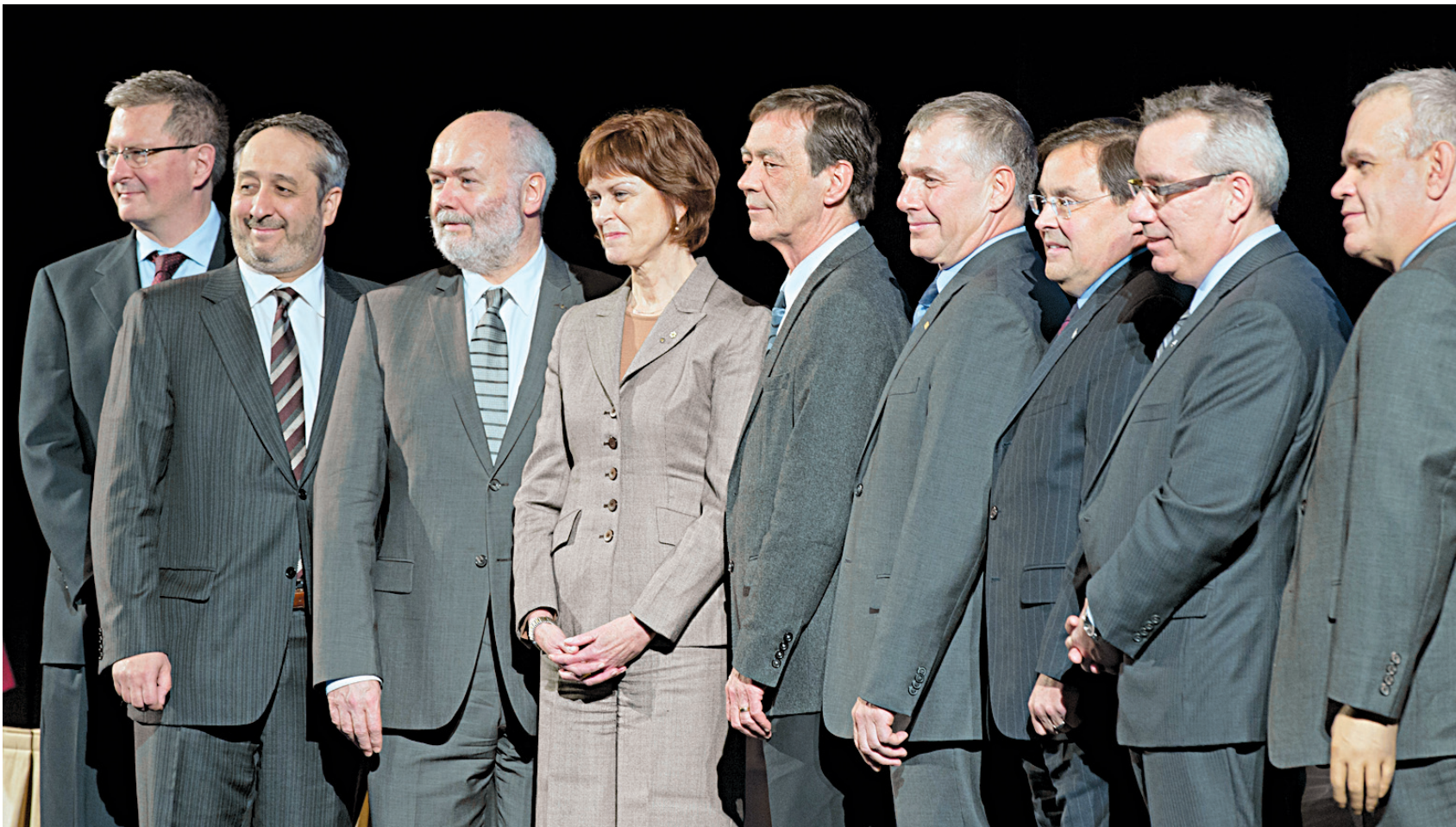
Réunis de manière exceptionnelle sur une même tribune en février dernier, les recteurs — et une rectrice! — des neuf établissements montréalais se côtoient ici dans une apparente collégialité, universités membres du réseau UQ aux côtés des universités de recherche.

CAHIER B • LE DEVOIR, LES SAMEDI 4 ET DIMANCHE 5 MAI 2013