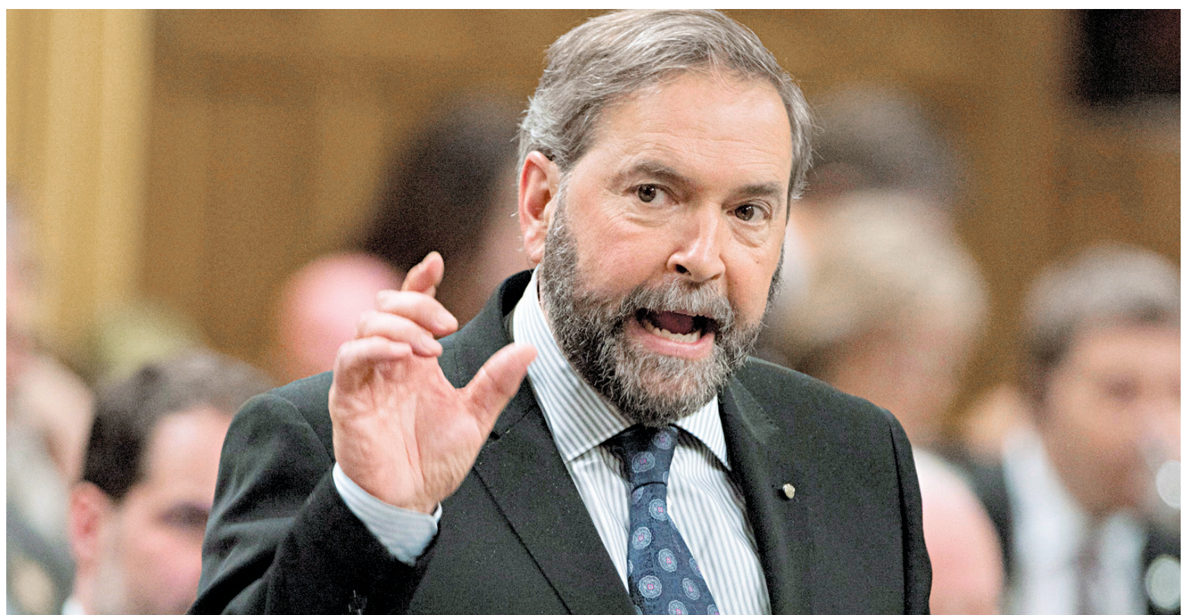
Thomas Mulcair est revenu sur le devant de la scène fédérale cette semaine.

Mais on doit aussi se demander s'il n'y a pas une raison plus fondamentale. Si, finalement, notre culture politique n'a tout simplement pas suivi l'évolution des lois et des attentes du public en matière d'éthique. Une culture politique qui n'arrive pas à se délester de ses travers et qui, en rebutant les citoyens, nous piège dans un cercle vicieux. Plus elle est sale, moins on a envie de s'en mêler. Moins on s'en mêle, plus elle reste à la merci des magouilleurs et pénalise ceux qui s'y engagent de bonne foi.