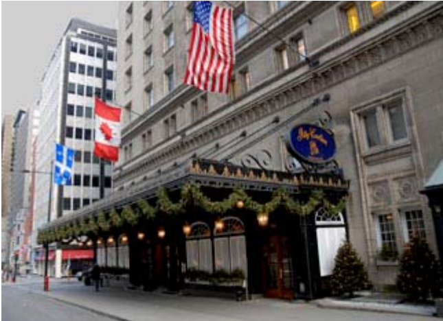
Hôtel Le Ritz de Montréal