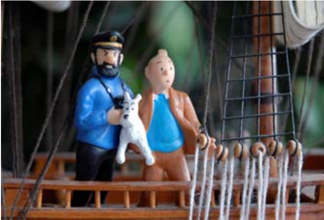
Tintin et le Capitaine

L'année 2007 sera marquée par les célébrations du Centenaire de la naissance d'Hergé , le créateur de Tintin. Le personnage est pour plusieurs le symbole du jeune journaliste parcourant le monde. Le premier ouvrage, dessiné en 1929, racontait le périple de Tintin en Russie: «Au pays des Soviets». En tout, 24 albums ont été publiés dont le dernier en 1986 (Tintin et l'Alph-art) où l'action se déroule dans le milieu des sectes. Cet album était resté inachevé à la mort d'Hergé, de son vrai nom Georges Rémi. Hergé est décédé en 1983.