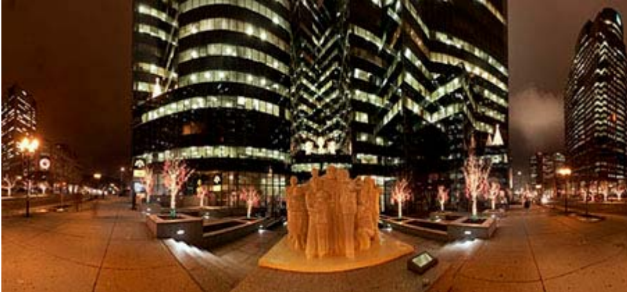
Centre-ville de Montréal

La photographie est un art en plus d'être un simple moyen de communiquer. Filippo Gallino, un photographe italien , dont le studio est situé à Torino, nous a fait parvenir cette photo de Montréal afin de démontrer les aspects artistiques de ses photos. Gallino utilise à la fois le film et le digital pour créer des scènes urbaines. Son site internet nous présente de nombreuses autres photos du genre prises un peu partout dans le monde.