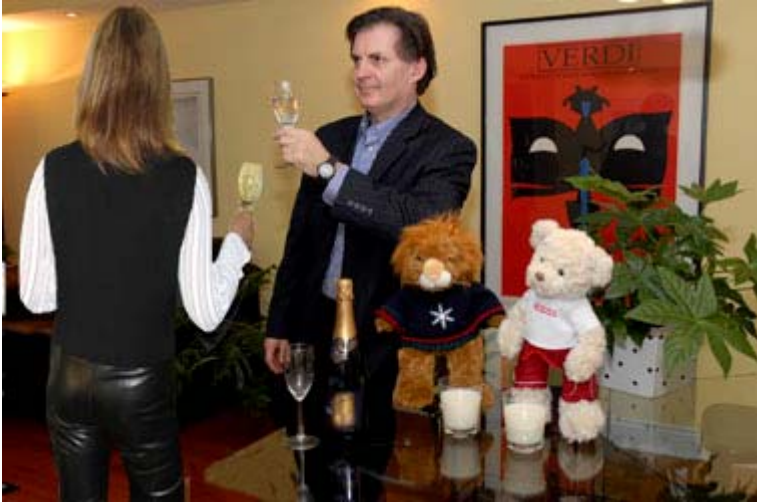
mademoiselle X, l'éditeur de LeStudio1.com et les deux mascottes, Monsieur X et sa soeur Miss Gym portant un toast à 2007.

«L'existentialisme, c'est quoi? Un moyen d'assurer mon existence!» Jean-Paul Sartre (répondant à un journaliste lors d'une visite à Cuba).