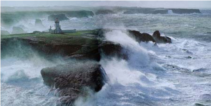
Pointe des Poulains

L'équipe de LeStudio1.com offre à tous ses lecteurs ses meilleurs voeux pour la nouvelle année 2007. Nous avons choisi une photo de Philip Plisson pour illustrer nos souhaits. L'image prise à Pointe des Poulains en Bretagne représente la vie.