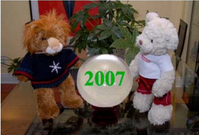
Monsieur X et Miss Gym devant une boule de cristal

L'année 2007 est imprévisible et les réalisations de 2006 ont démontré que les événements les plus incroyables peuvent souvent se produire. Malgré cette situation, l'équipe de LeStudio1.com s'est amusé à faire ses prédictions!