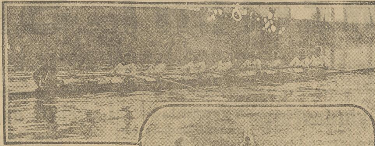
La grande course en canots en Angleterre. La photographie du haut est celle de l'équipe d'Oxford qui a gagné la course.