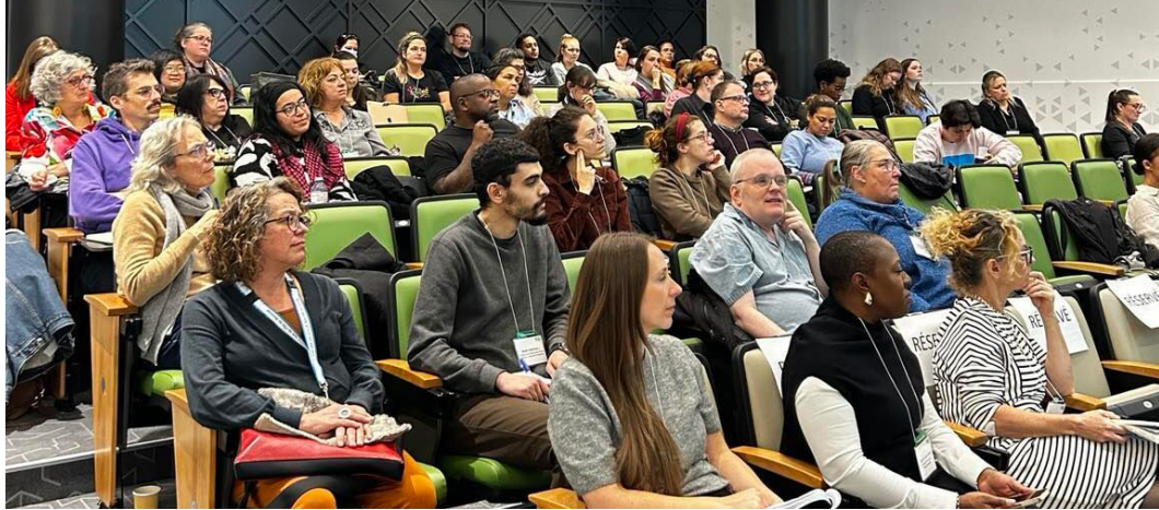
Demi-journée de réflexion dans le cadre de notre campagne Je pratique la gentillesse