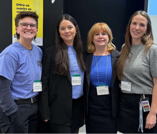
L'équipe de travail de Je pratique la gentillesse