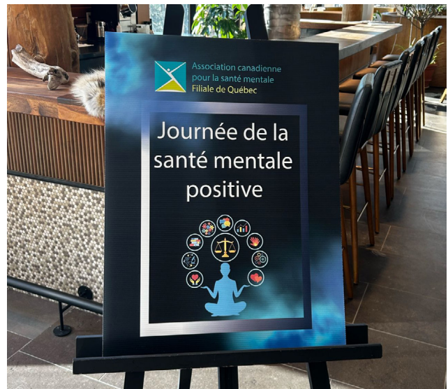
Événement de l'ACSM Filiale de Québec pour la Journée de la santé mentale positive

de gestes gentils recueillis du grand public