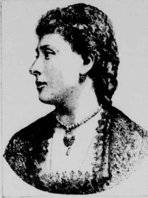
S.A.R. LA PRINCESSE BÉATRICE, Fiancée au prince de Battenberg