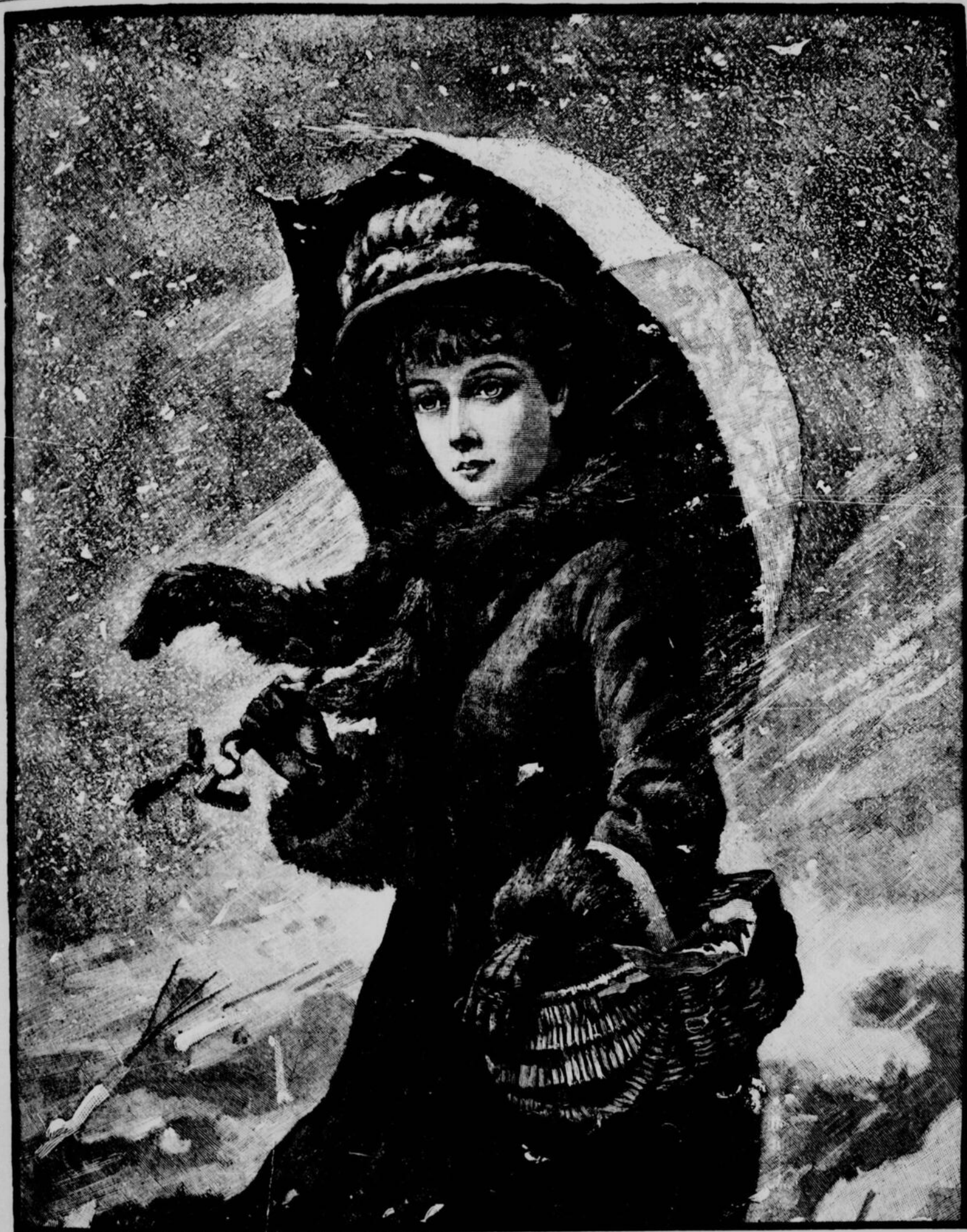
PAR UN TEMPS DE NEIGE.

ABONNEMENTS : Six mois : $1.50. — Un an : $3.00.