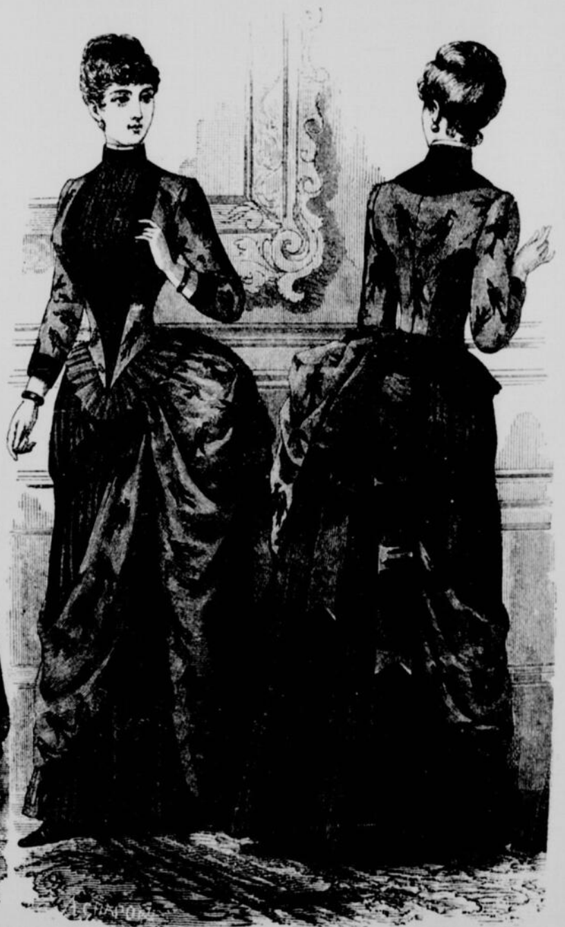
COSTUME EN SOIR ET LAINAGE.