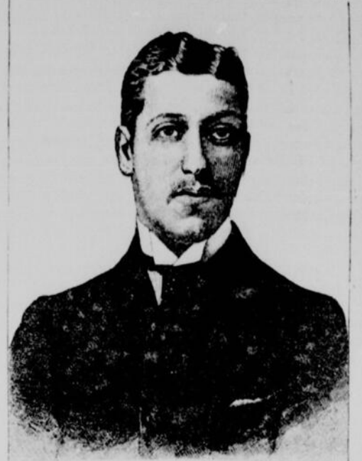
S.A.R. LE PRINCE ÉDOUARD DE GALLES, Fils aîné du prince de Galles