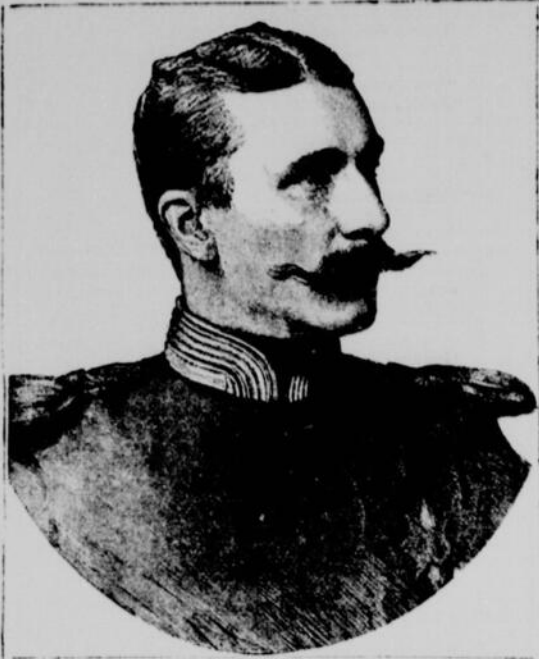
S.A.R. LE PRINCE DE BATTENBERG, Fiancé à la princesse Béatrice.