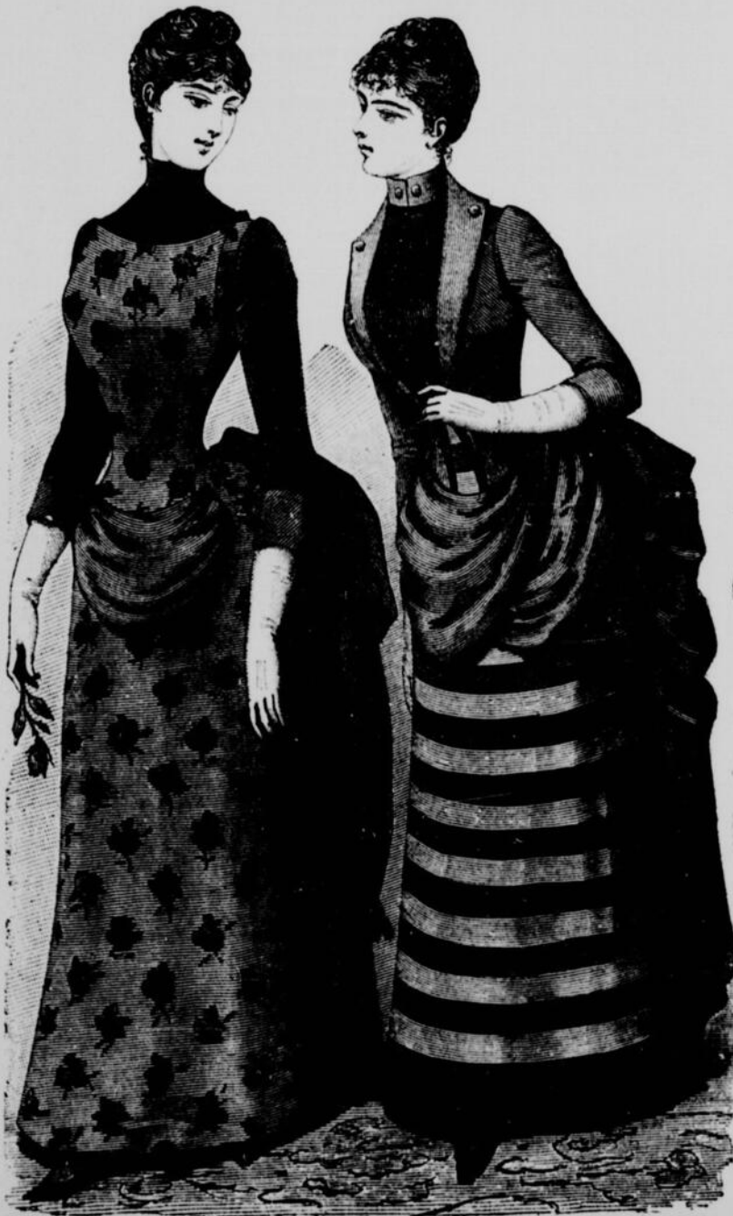
TOILETTE EN VELOURS.