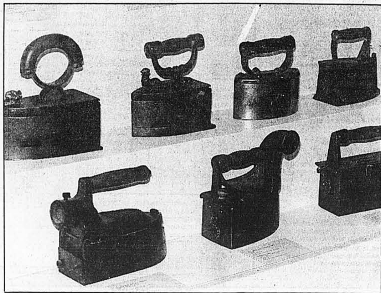
Il fut une époque où, pour employer un fer à repasser comme l'un de ceux-ci, il fallait d'abord le remplir de charbons ardents... Pour remonter dans le temps grâce à cette collection inusitée, voir les détails sous le titre EXPOSITIONS, dans cette page.

Jusqu'au mercredi 1er juin, sont exposées à la Bibliothèque municipale de Brossard, 3200, boulevard Lapinière, les caricatures présentées au concours organisé en février dernier par la Galerie de la Société culturelle de Saint-Lambert. L'exposition est accessible aujourd'hui de 11 h à 17 h. Renseignements: 656-5960.