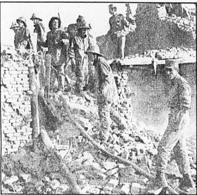
Des soldats et secouristes fouillent les débris de maisons détruites par l'explosion d'un camion piégé qui a fait 16 morts et 12 blessés.

Cette élection, en fait, a traduit la double volonté de son prédécesseur Lionel Jospin — aujourd'hui N° 2 du gouvernement, derrière Rocard — d'ancrer le parti à gauche et de contrecarrer les ambitions présidentielles de Laurent Fabius, en protégeant les siennes.