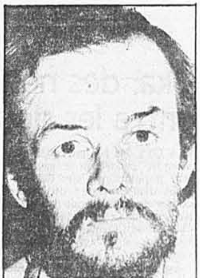
En juillet dernier, le Jihad islamique faisait parvenir cette photo à une agence de presse occidentale à Beyrouth, accompagnée d'un communiqué affirmant que tous les otages seraient exécutés si Paris n'accédait pas à ses demandes.