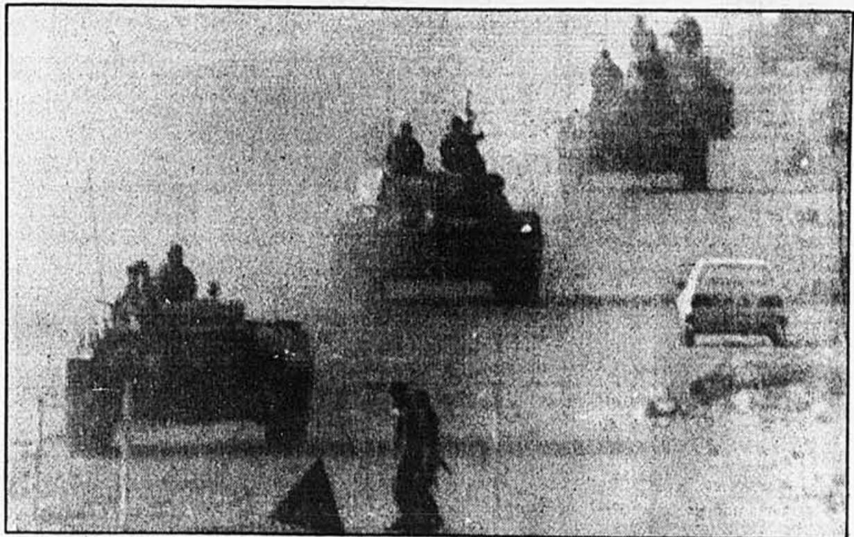
L'avant-garde de quelque 300 véhicules blindés et plusieurs milliers d'hommes de troupe ont commencé à converger vers la banlieue sud de Beyrouth hier matin. PHOTOLASER AP

Amal et Hezbollah s'affrontent en des combats qui ont fait au moins 180 morts depuis le 6 mai, et qui ont permis aux intégristes de Hezbollah de prendre le contrôle de la quasi-totalité de la banlieue sud.