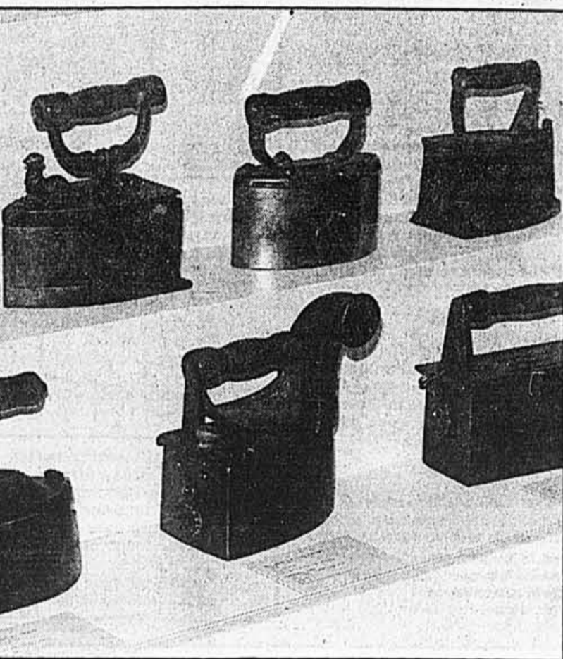
Il fut une époque où, pour employer un fer à repasser comme l'un de ceux-ci, il fallait d'abord le remplir de charbons ardents... Pour remonter dans le temps grâce à cette collection inusitée, voir les détails sous le titre EXPOSITIONS, dans cette page.

Salle, organisée par Les Kilomètres, a lieu aujourd'hui. Le secrétariat ouvre à 7 h, à l'école LaSalle Catholic High. Les départs pour les épreuves de 15, 10, 3 et 1,5 kilomètres ont lieu à l'angle de la rue Bishop et du boulevard LaSalle. À noter que la catégorie 3 kilomètres est nouvelle. Trophées, décorations et prix de présence.