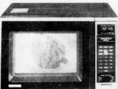
FOUR MICRO-ONDES ÉLECTRONIQUE (la photo peut légèrement différer du modèle en spécial)