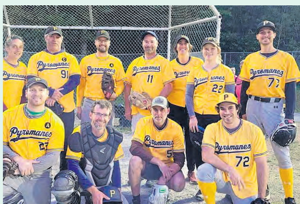
Les pyromanes sont une des sept équipes de la ligue.

Apparue dans le décor cap-chatien il y a trois ans, l'intérêt n'a jamais cessé de croître alors que des mordus de balle molle de tous âges se donnent rendez-vous toutes les semaines, les mercredis et jeudis, dans une atmosphère de compétition amicale. La prochaine saison débutera le 11 juin pour se terminer le 11 septembre. Les règlements sont les mêmes que l'an dernier et la formule participative reste à l'honneur.