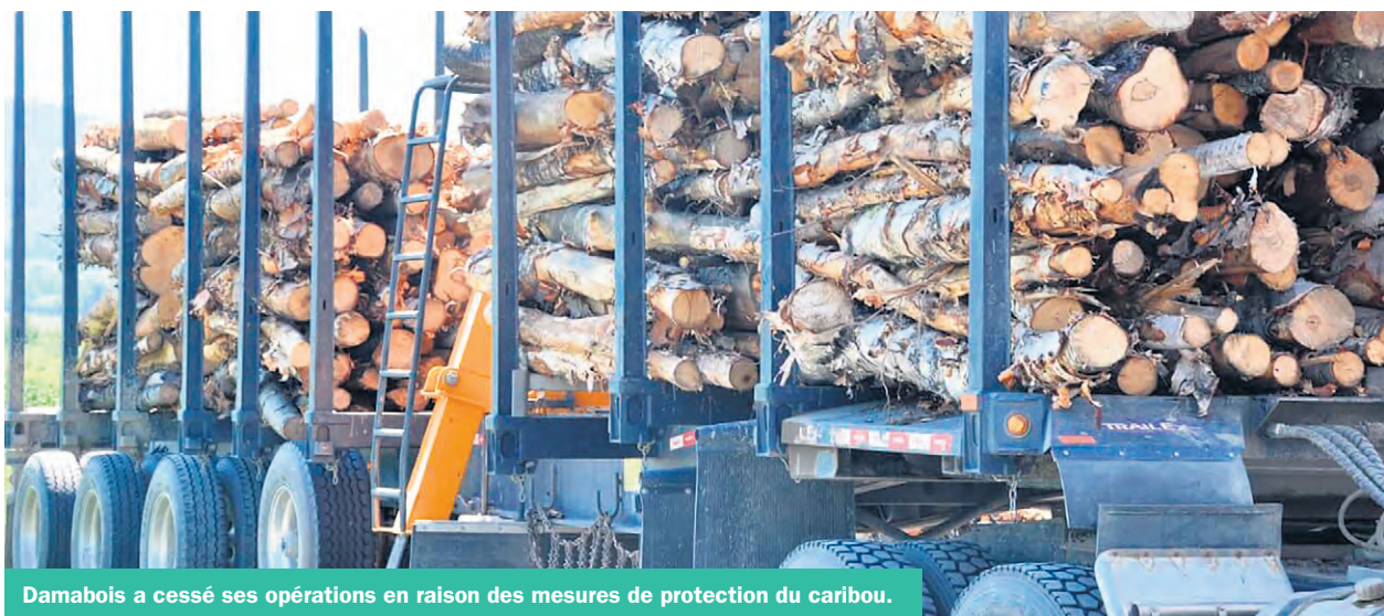
Damabois a cessé ses opérations en raison des mesures de protection du caribou.