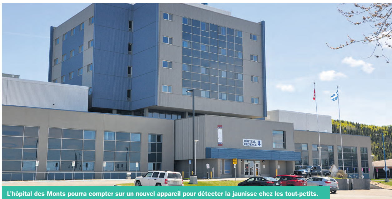
L'hôpital des Monts pourra compter sur un nouvel appareil pour détecter la jaunisse chez les tout-petits.

Opération Enfant-Soleil a aussi remis une somme de 2 500 $ à la direction du volet Déficience intellectuelle et trouble du spectre de l'autisme, et Déficience physique pour l'aménagement d'une nouvelle salle sensorielle située au point de services de la route du Parc à Sainte-Anne-des-Monts.