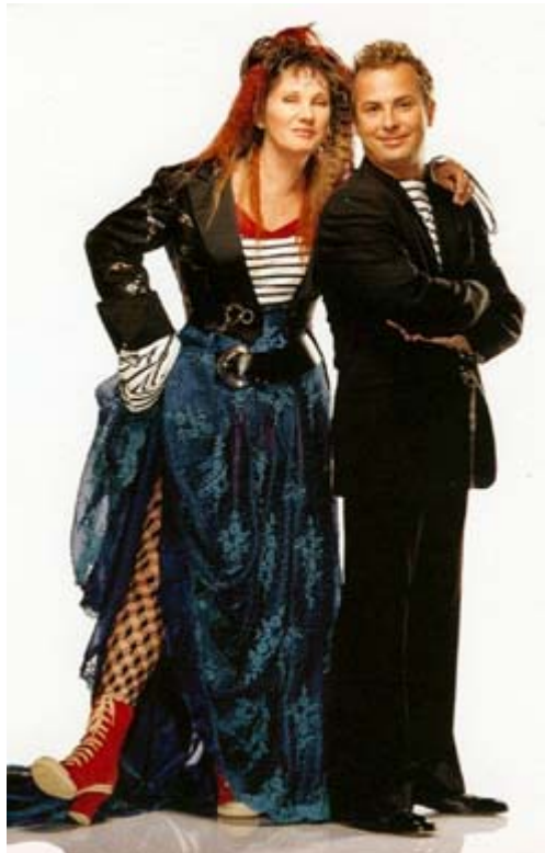
Diane Dufresne et Yannick- Nezet Séguin