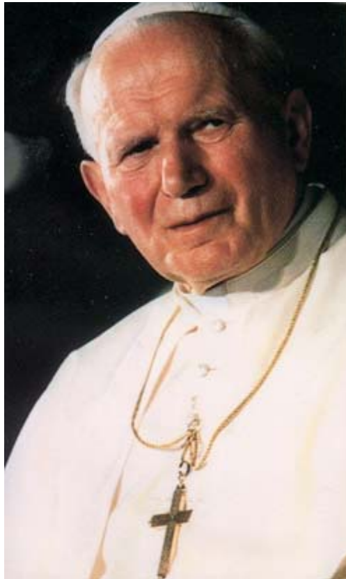
Sa Sainteté Jean-Paul II