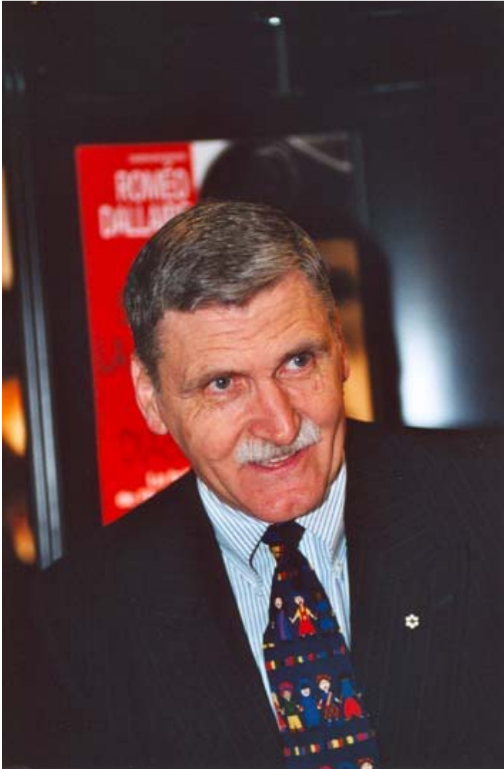
Lieutenant-Général Roméo A. Dallaire