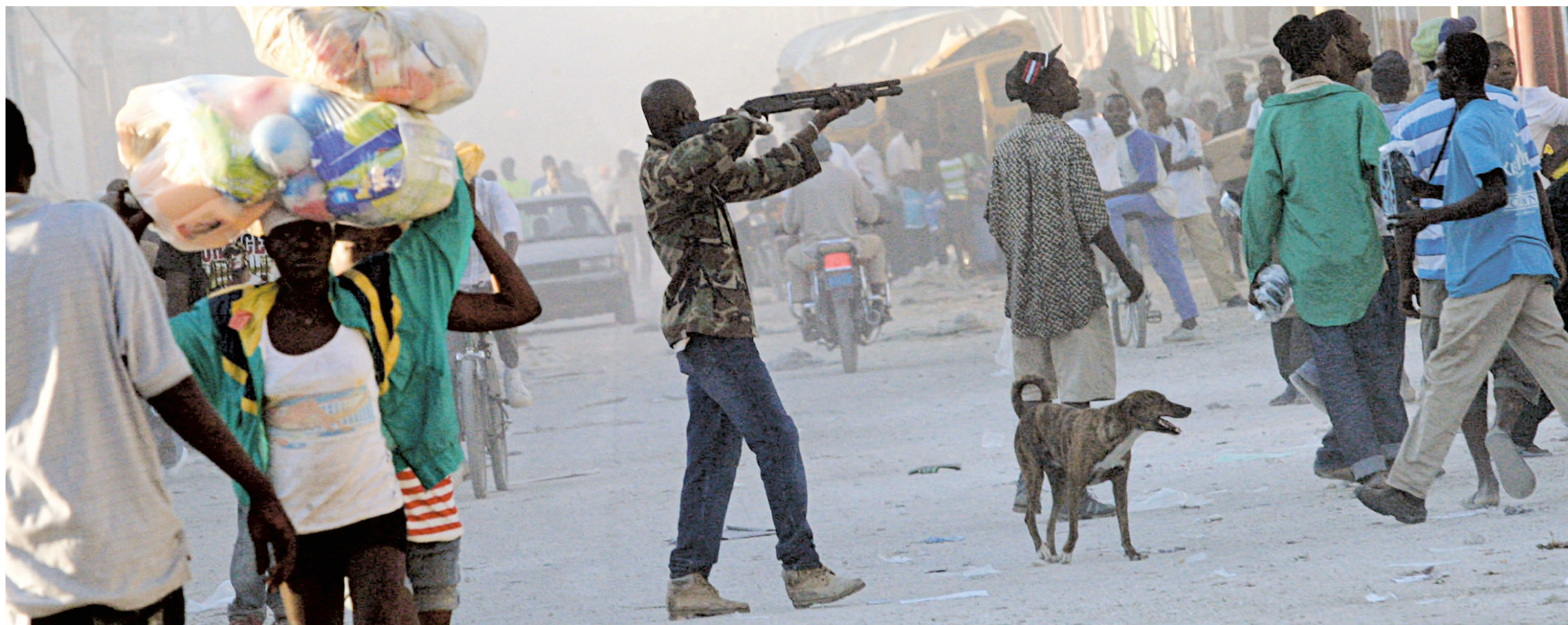
KENA BETANCUR REUTERS

Un homme pointe une arme sur la foule dans le centre-ville de Port-au-Prince, après avoir tiré quelques coups en l'air pour faire fuir des pillards qui s'en prenaient à sa boutique. Dans la capitale haïtienne ravagée par le tremblement de terre de mardi dernier, les scènes de violence se font de plus en plus fréquentes.