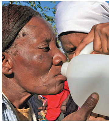
L'eau fait cruellement défaut à Haïti.

Le public a également dirigé ses dons vers la Coalition humanitaire qui regroupe Oxfam, Care Canada et Aide à l'enfance Canada. Plus d'un million a été reçu. La même somme a été recueillie par le Centre d'étude et de coopération internationale (CECI).