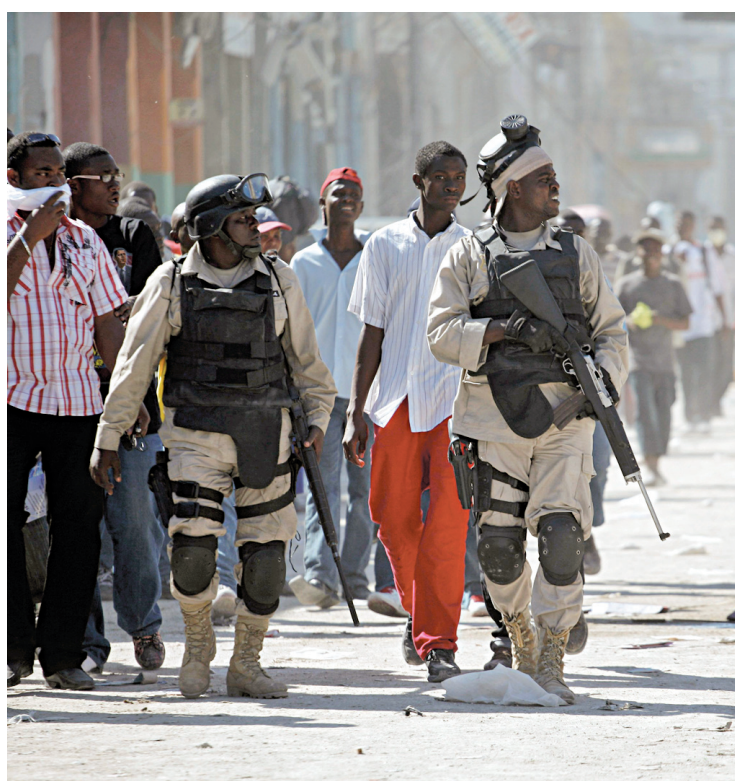
CARLOS BARRIA REUTERS