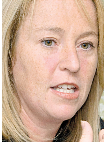
Caroline St-Hilaire

En d'autres mots, les sommes que les contribuables ne paieront pas cette année, ils devront s'en acquitter l'an prochain puisque ces contorsions comptables se traduiront par une augmentation minimale des taxes de 2,3 % en 2011. Les montants puisés