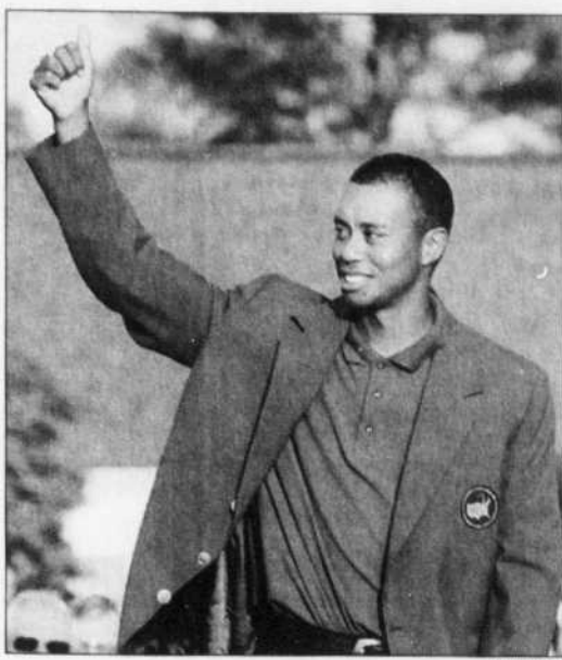
Un Tiger Woods triomphant salue la foule.

Comme nombre d'autres grands golfeurs, Weir a éprouvé des ennuis avec le parcours modifié d'Aug-