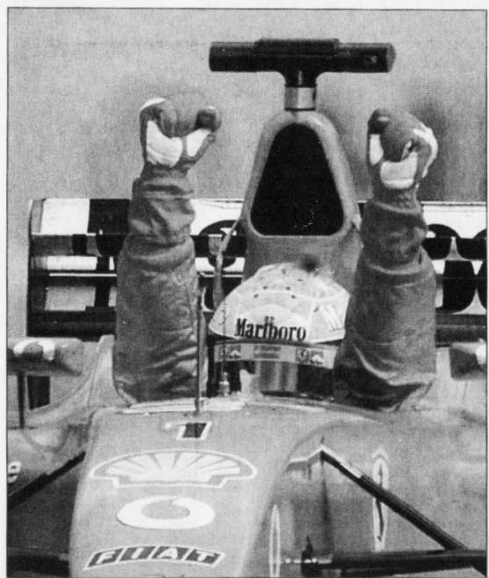
Michael Schumacher était visiblement très heureux de remporter ce Grand Prix d'Imola.

Le prochain Grand Prix de la saison se déroulera à Barcelone, le 28 avril.