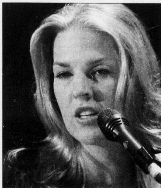
Les membres de l'Académie ont décerné à Diana Krall le Juno du meilleur album de l'année pour The Look of Love.

La cérémonie d'hier était animée par le groupe torontois Barenaked Lady et a mis en vedette Diana Krall, Nickelband, Nelly Furtado, Alanis Morissette,