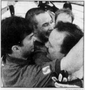
L'équipe canadienne de curling a éclaté de joie après sa victoire d'hier au championnat du monde de curling.

Trulsen était la bête noire du Canada depuis environ un an, ayant défait Kevin Martin pour le titre olympique en février ainsi que Ferbey l'an dernier dans le match pour l'obtention de la médaille de bronze aux cham-