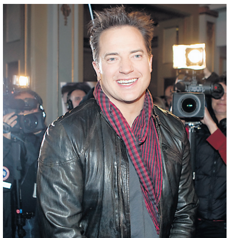
Brendan Fraser, hier à Montréal.