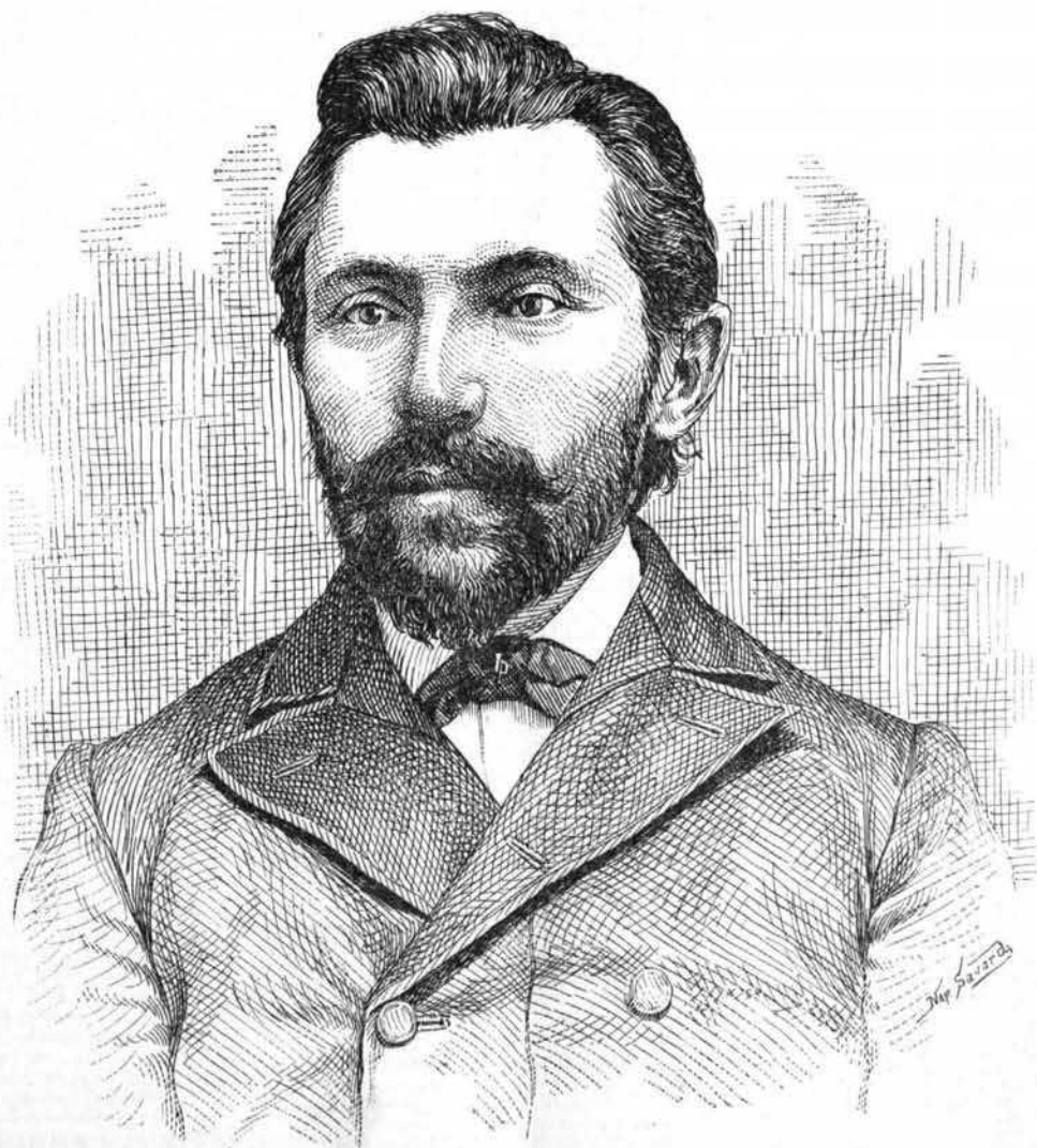
Dessin de N. SAVARD, d'après une photographie de Laprés & Lavergne.

BUREAU 58 Rue St-Gabriel, Montreal BOITE 2169