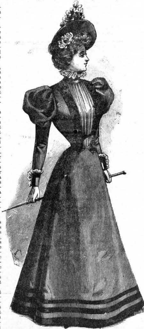
TOILETTE DE PROMENADE

garni en dessous par une rose sur le côté, et en dessus par un bouquet de roses posé en aigrette sur le devant.