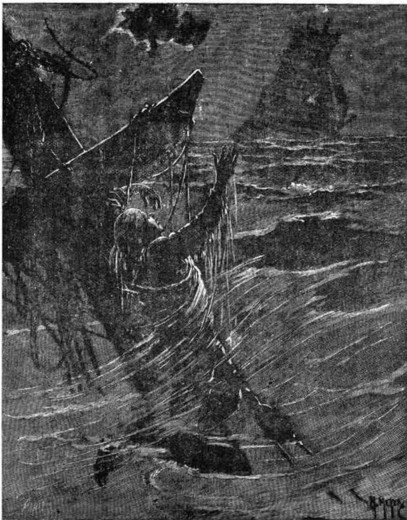
Georges poussa des cris de détresse. (Page 115.)

Les Esquimaux, atteints de refroidissements, se guérissent en provoquant une transpiration abondante.