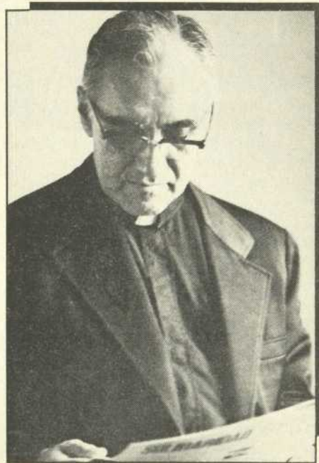
Mgr Oscar Romero