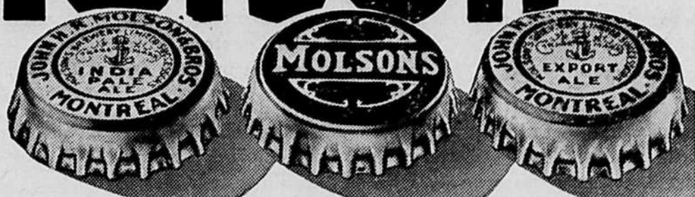
INDIA PALE (étiquette blanche) STOCK (étiquette bleue) EXPORT (étiquette dorée)