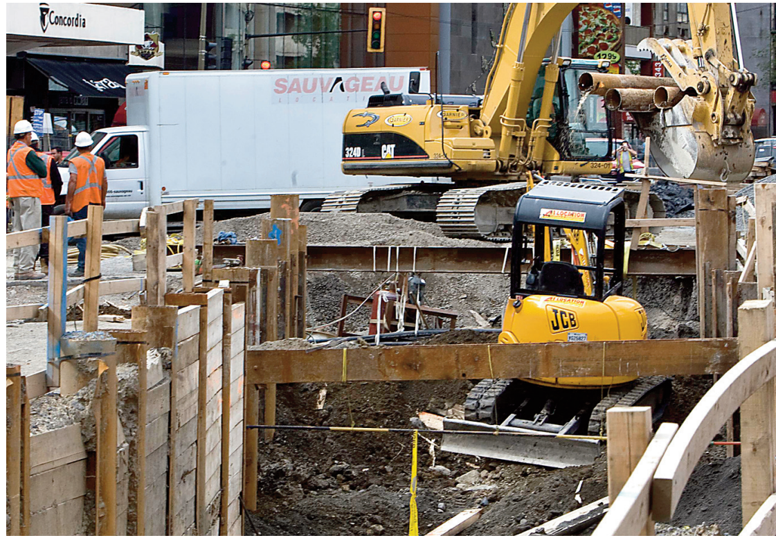
Le climat de suspicion autour des entreprises de génie ralentit considérablement les travaux de voirie à Montréal.

Ce climat de suspicion envers les firmes de génie ralentit de façon importante les travaux