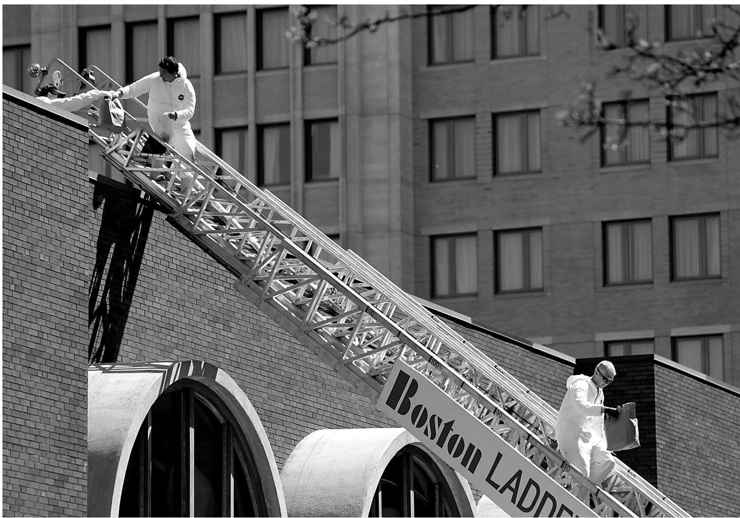
Des enquêteurs du FBI quittent le toit d'un immeuble de Boston en emportant un sac. Les enquêteurs se sont activés toute la journée de mercredi sur le lieu des explosions qui ont fait trois morts et plus de 180 blessés.