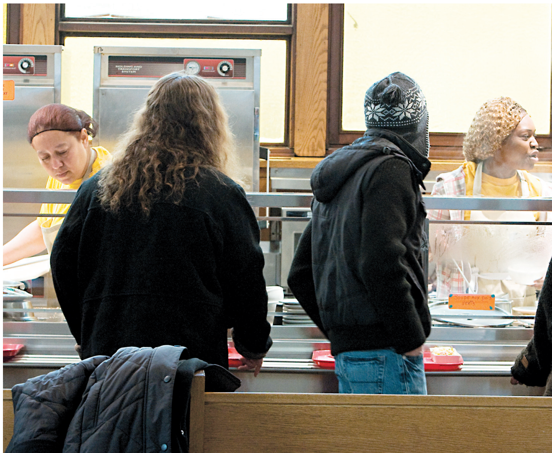
Les réformes des ministres Finley et Maltais vont encore plus enfermer dans les mauvais emplois les femmes et tous ceux et celles, autochtones, jeunes, immigrants, qui sont en position vulnérable.

Mais refuser l'emploi à bon marché et affirmer son droit à choisir un travail décent constituent un parcours à haut risque. Parce que du travail, de toute façon, il n'y en a pas pour tout le monde. Avec un taux à 7,7% au Québec (7,2% pour le Canada), nous sommes toujours en situation de fort chômage. En évoquant, à tort ou à raison, que 700 000 emplois seront à pourvoir d'ici 2016, le ministère québécois de l'Emploi et de la Solidarité sociale l'a d'ailleurs reconnu. Pourtant, il veut couper dans le maigre 129 dollars de supplément au montant d'aide sociale (qui ne couvre de toute façon pas les besoins de base) en visant les catégories de population qui vont — mécaniquement — venir gonfler les de-