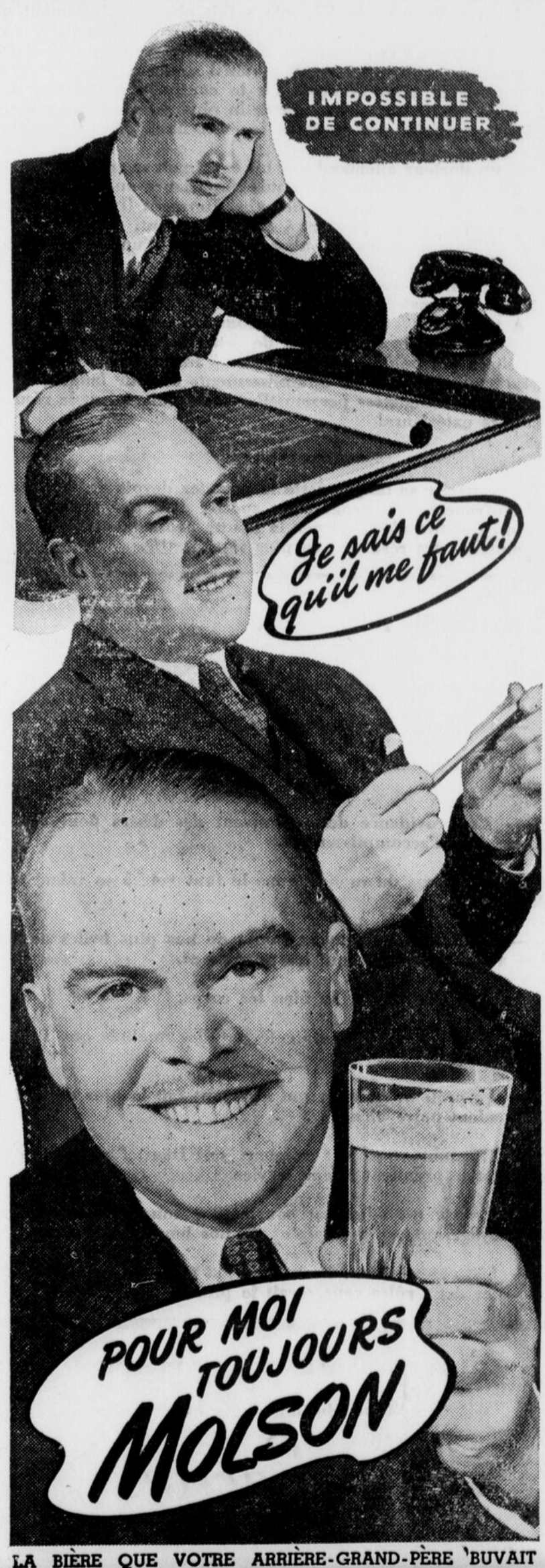
LA BIÈRE QUE VOTRE ARRIÈRE-GRAND-PÈRE 'BUVAIT