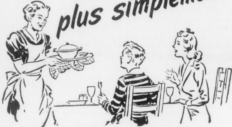
Voici ce que je dis: "Tant que mon Jacques sera à la guerre, nous devons couper sur les desserts."

Serrons-nous la ceinture, mangeons plus simplement