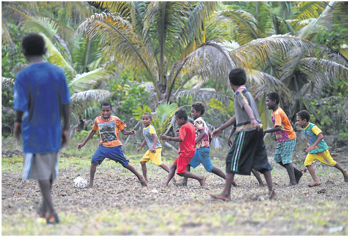
Nombre de Papous ne terminent pas leurs études secondaires, mais s'occupent de leurs frères et sœurs et passent leur temps au bord des plages.