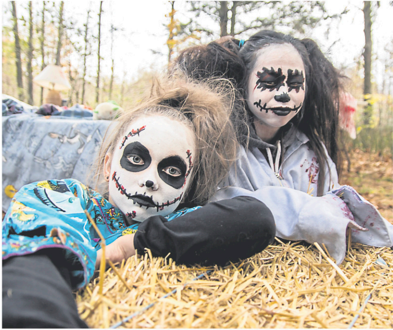
Le Festival Frissons de Mascouche est destiné aux familles, avec plusieurs activités pour les enfants.

d'enfance (poupées, loups-garous et monstres sous le lit) prennent vie. Tableaux effrayants, comédiens qui ne demandent qu'à nous faire sursauter... Non conseillé aux moins de 10 ans. Entrée : 2 $. Pour les plus jeunes, plusieurs activités sont prévues les 28 et 29 octobre : maison «hantée» sur le thème de