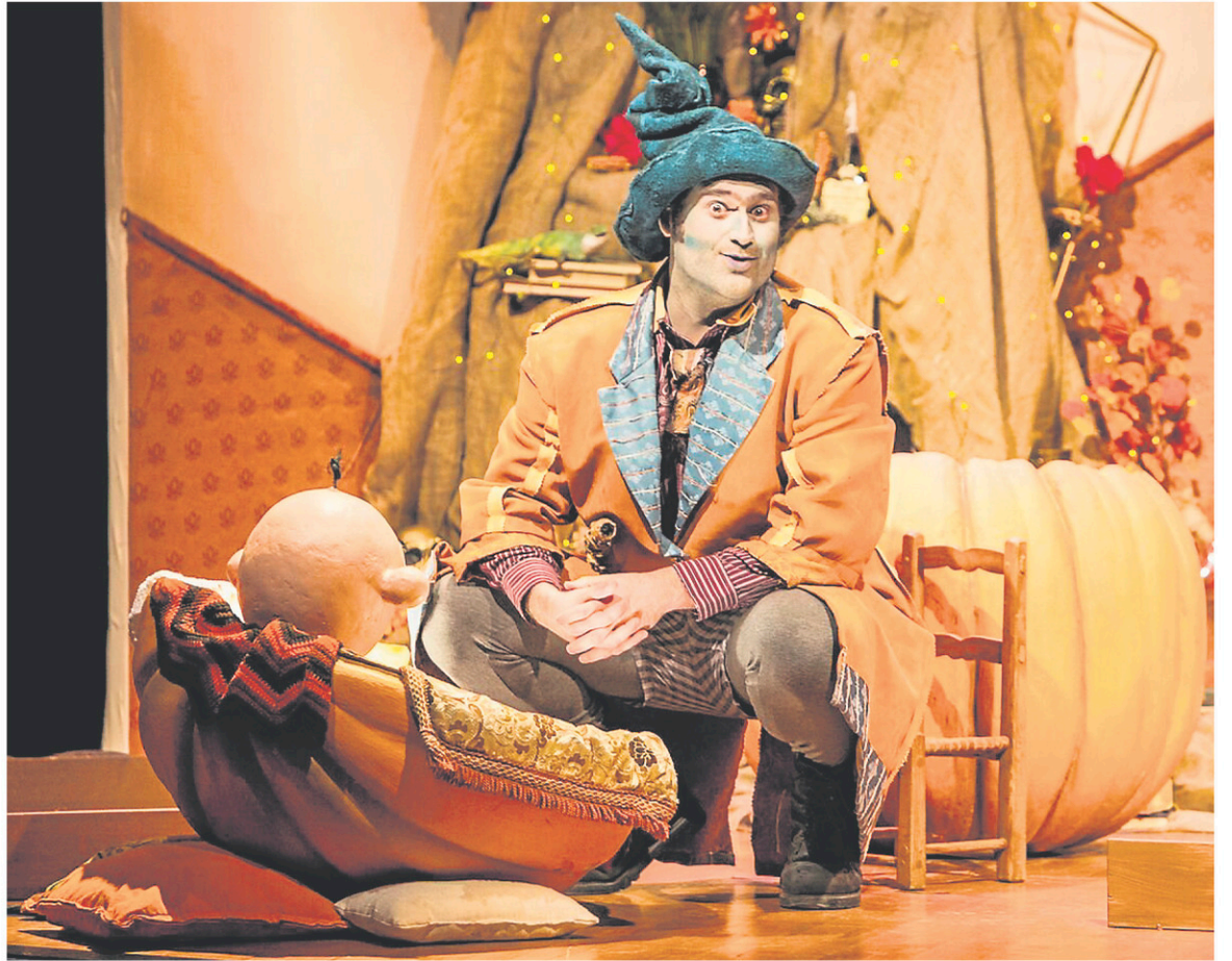
La grande nouveauté des festivités d'Halloween au Jardin botanique : le conte animé POUAH, bébé sorcière .

Centre de la nature de Laval 901, avenue du Parc, Laval Jusqu'au 29 octobre laval.ca/centredelanature