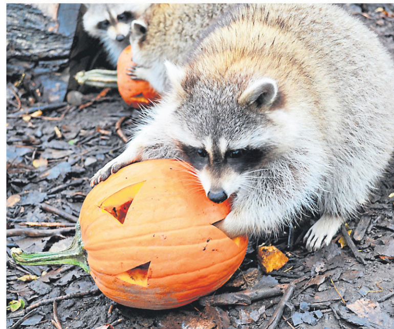
L'Halloween est une occasion d'en apprendre davantage sur les pensionnaires de Zoo Ecomuseum.

Vieille prison de Trois-Rivières Jusqu'au 11 novembre culturepop.qc.ca