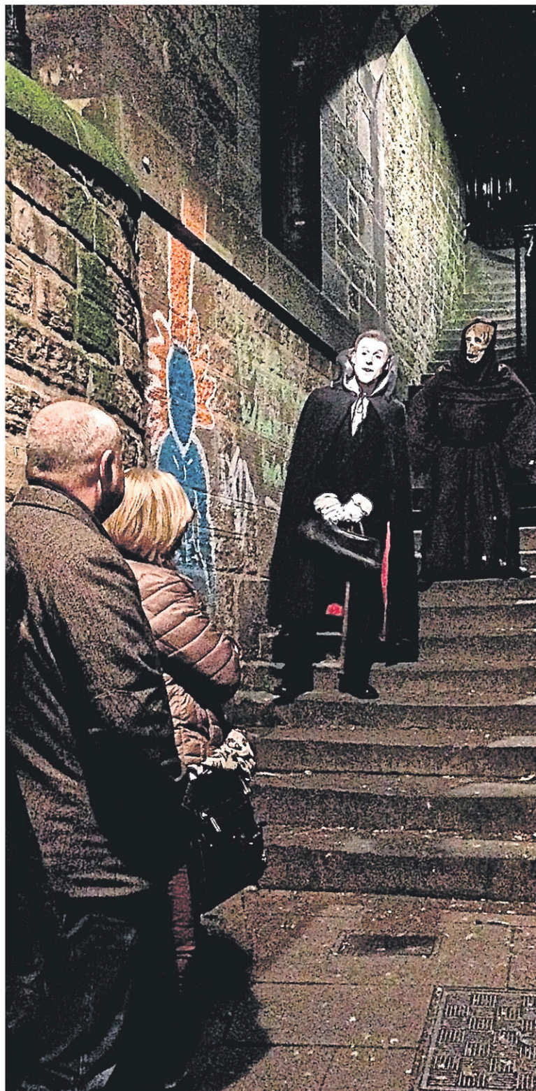
Le Murder & Mystery Tour propose une virée de plus d'une heure à environ 16 $CAN par personne, où se mélangent humour, histoires de peur et faits avérés qui permettent de mesurer la sanglante histoire d'Édimbourg, fondée au XI e siècle.