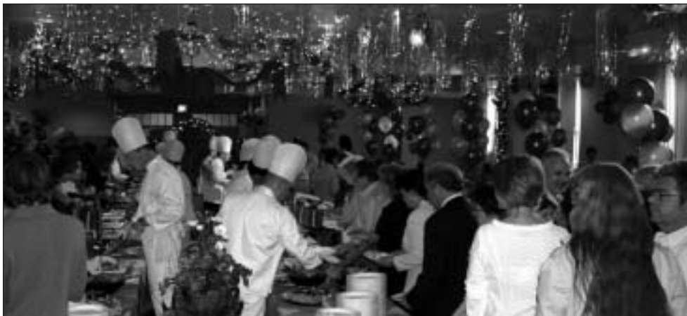
La salle Filteau, superbement aménagée pour l'occasion.

Sylvie Desmarais directrice des ressources humaines