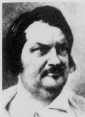
Honoré de Balzac