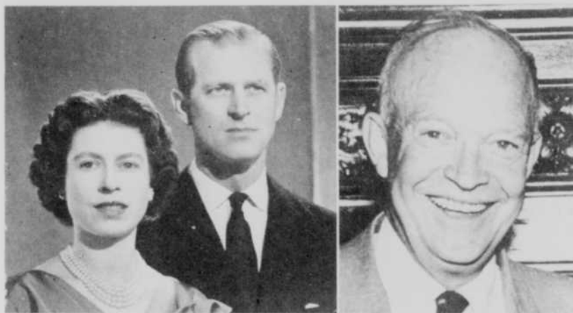
Sa Majesté la reine Elisabeth II et Son Altesse royale le prince Philippe

La Voie maritime s'avance jusqu'à 2,340 milles à l'intérieur des terres. Ingénieur ou manoeuvre, architecte ou homme-grenouille, l'homme travaille. Il arrache au fleuve 57,000,000 de