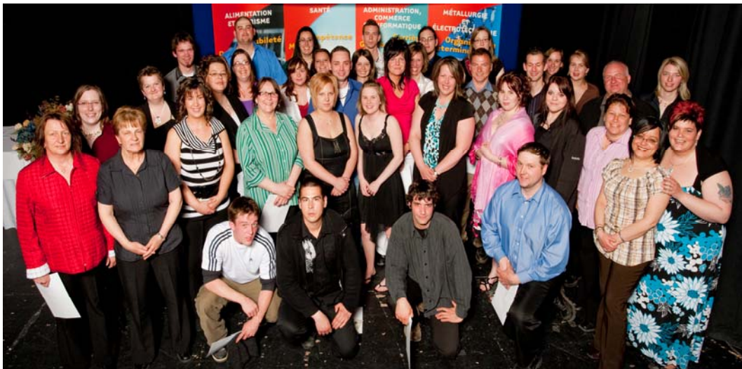
Les gradués étaient tout sourire au terme de la soirée.