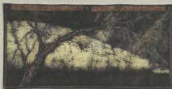
TOGAKASHI, OEUVRE DE LILI RICHARD.