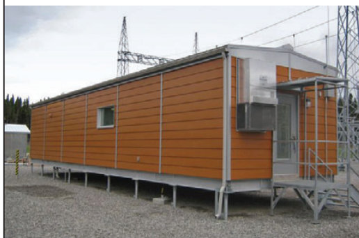
Exemple de bâtiment d'automatismes pour la commande d'un poste