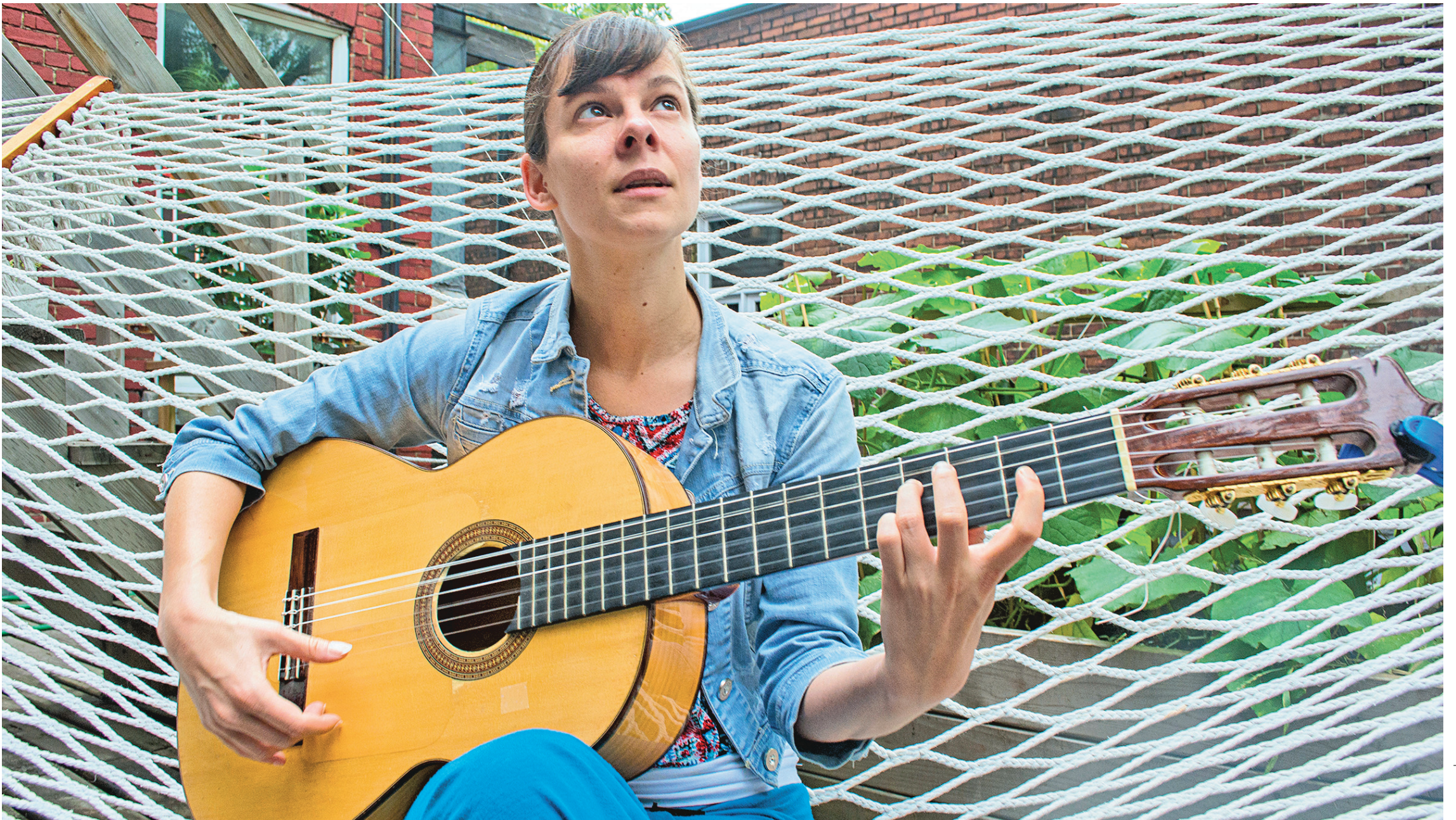
MICHAËL MONNIER LE DEVOIR

CAHIER E • LE DEVOIR, LES SAMEDI 6 ET DIMANCHE 7 SEPTEMBRE 2014