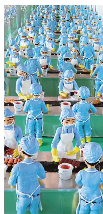
Karine Giboulo, All You Can Eat (détail), 2008.

De là, Giboulo a mis au point les dispositifs qui ont fait la renommée de son travail et dont sont emblématiques les œuvres Cité de rêve (2013), Village démocratie (2010-2012) et All You Can Eat (2008), toutes trois de l'exposition, ainsi qu'une nouvelle œuvre inédite, HYPER-Land . Une armada de figurines en argile polymère colorée est déployée dans ces imposantes installations pour il-