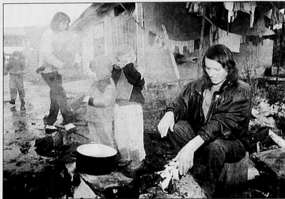
Plusieurs Kosovars ont trouvé refuge à Sarajevo, en Bosnie.