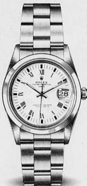
OYSTER PERPETUAL DATE

Les horlogers suisses guidés par un souci de perfection exécutent au moins 150 étapes délicates pour sculpter la Rolex Oyster dans un bloc de métal. Le résultat est un «coffre-fort» miniature virtuellement inviolable dont l'étanchéité est garantie jusqu'à une profondeur d'au moins 100 mètres. Il n'est donc pas surprenant que la Rolex Oyster soit reconnue depuis 1926 comme la montre-bracelet la plus étanche au monde.