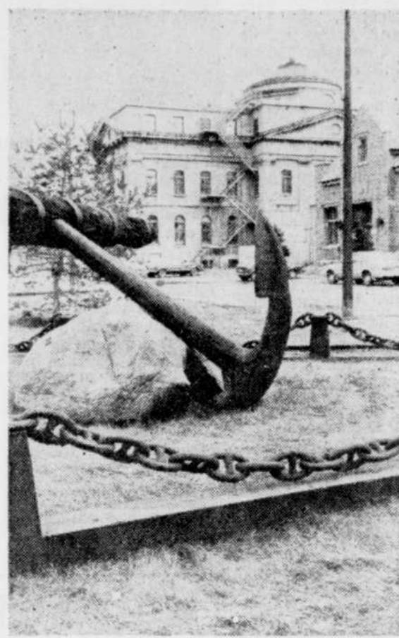
Cette ancre-là appartient à Transports Canada depuis fort longtemps et elle marque l'entrée du vieux port à Québec.

Sinon, les actifs seront vendus au profit du receveur général.