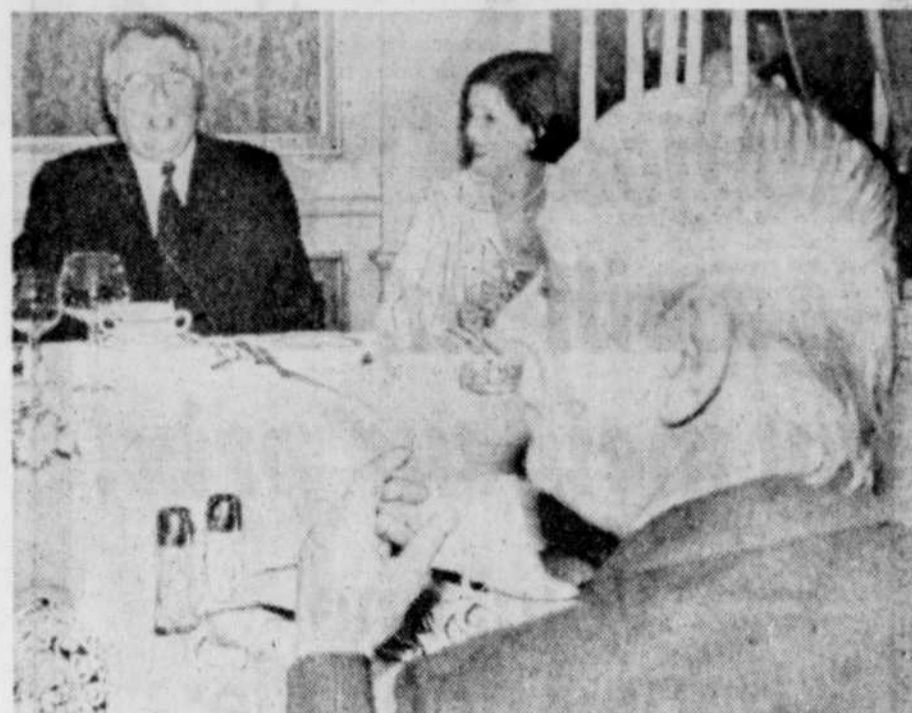
Au cours d'un dîner officiel, hier soir à Montréal, le premier ministre Mauroy a échangé une plaisanterie avec l'épouse du premier ministre, Mme Corinne Côté.

Le projet actuel prévoit l'installation de deux cuves d'une capacité de 110.000 tonnes métriques chacune. La construction de l'usine prendrait trois ans et entraînerait la création de 800 emplois directs et 2.000 emplois indirects.