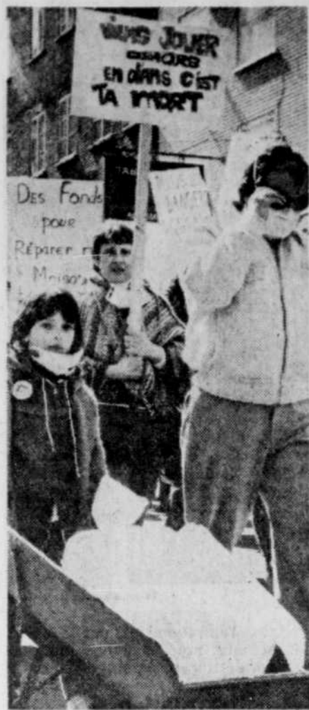
Un gros sac de la "mousse maudite" transporté dans une brouette, les pancartes, les épithètes scandées par les marcheurs de même que leurs accoutrements, tout contribuent à mettre les passants dans l'ambiance.