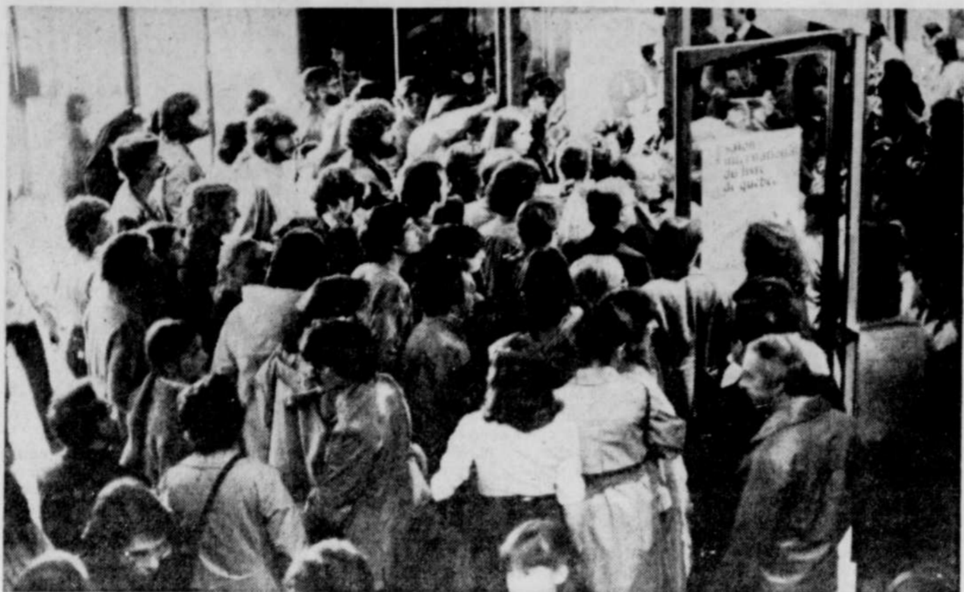
Les files d'attente étaient longues samedi à l'entrée du Salon du livre.

Ces bonnes affaires, elles s'exercent en bonne partie par la faible