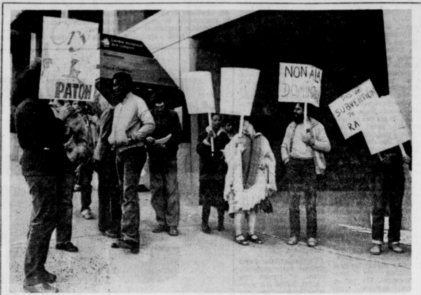
Non! à l'apartheid Un petit groupe de manifestants armés de pancartes et diffusant leur propagande aux passants, samedi devant le Centre municipal des congrès de Québec, contre la présence de l'Afrique du Sud au Salon du livre. Organisé par le centre de ressources universitaires en développement international, Carrefour Tiers-monde, la CSN et le comité antiapartheid de Québec, la démonstration dénonçait la politique d'apartheid de l'Afrique du Sud.

Mais un homme qui aurait tenu maison durant un couple d'années tout en consacrant ses énergies à la gestion de l'Association des consommateurs du Canada pourrait — du moins je l'imagine — faire valoir ses états de services non rémunérés durant ce temps, comme expérience pertinente pour diriger un service gouvernemental.