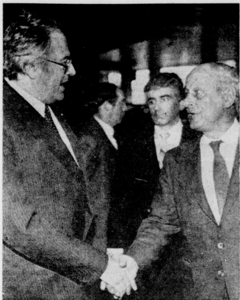
Le premier ministre Lévesque accueille le premier ministre français, M. Pierre Mauroy, à son arrivée dans un hôtel de la métropole après une journée consacrée à de courtes visites à Chicoutimi et à Trois-Rivières.