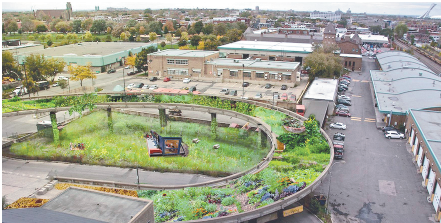
MAQUETTES CATHÉDRALE VERTE

Quant au verdissement de l'incinérateur, la planification est l'aménagement de la fameuse rampe d'accès avec 15 potagers en bac, l'installation de 20 écosystèmes en pots et la construction de deux pergolas végétalisées. Le tout serait irrigué par un système d'arrosage qui fonctionne avec la gravité.