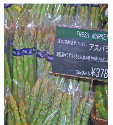
Au Japon, même les asperges sont emballées.