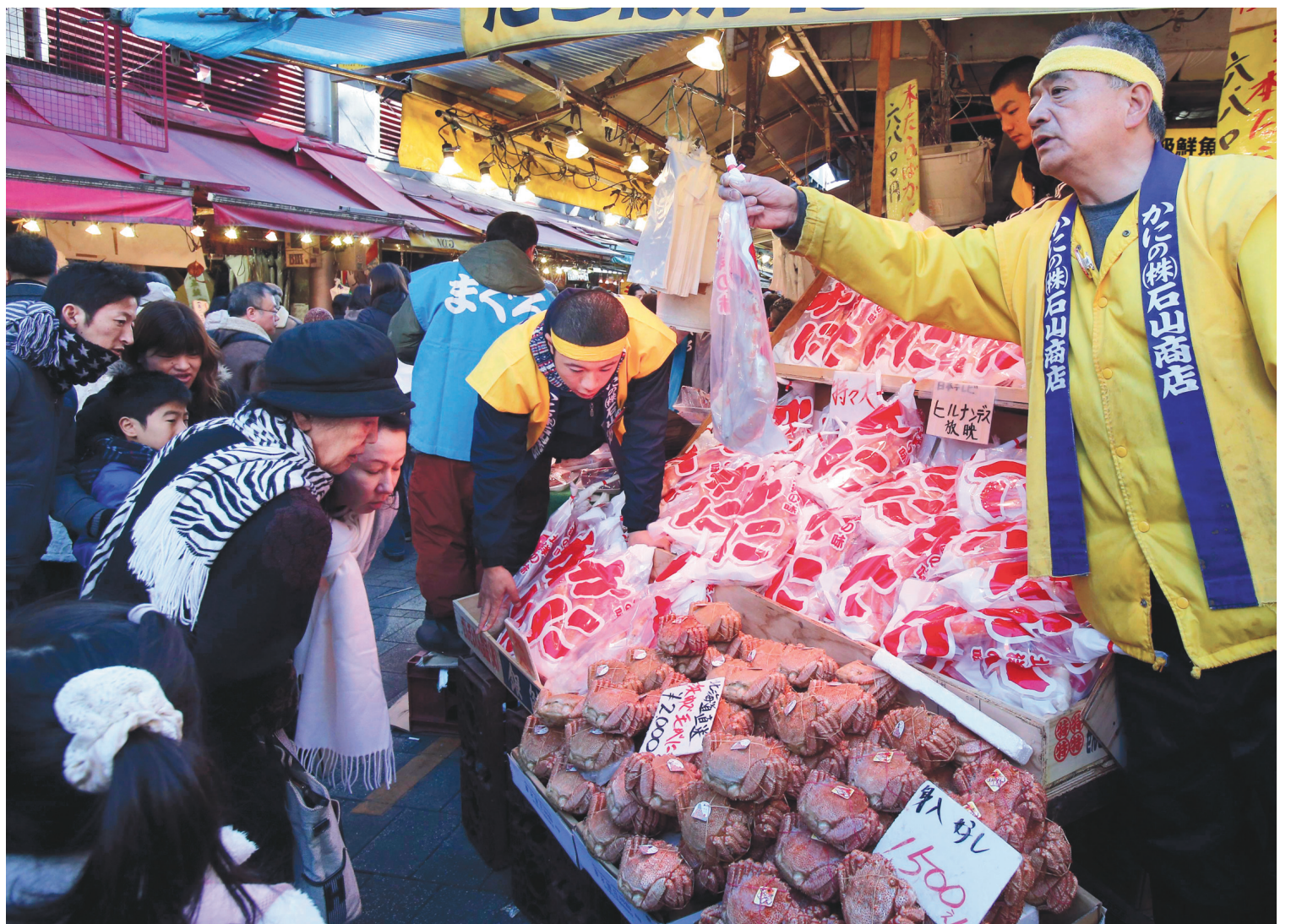
Le poisson a toujours été présent dans le régime nippon. Les marchés de poisson et fruits de mer sont grandement fréquentés. Tout ce qui provient de la mer peut être consommé, affirme-t-on en ce pays.

On a longtemps cru que les Asiatiques étaient intolérants au lactose. Avec le libre-échange avec des pays comme