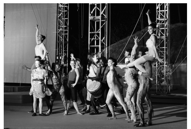
Une fois par semaine, la quinzaine de Gentils Circassiens font une démonstration des disciplines de CREACTIVE.