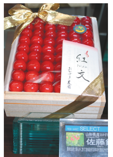
Les fameuses cerises japonaises sont recherchées.