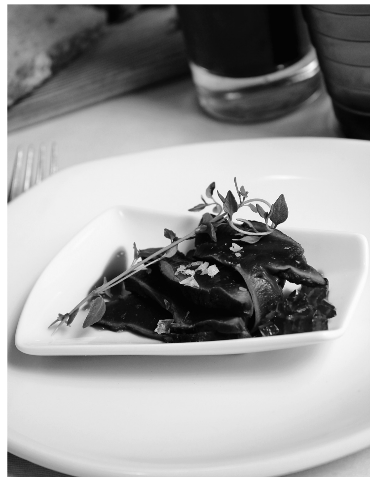
Assiette de cœur de renne fumé et sa gelée de vin de mûres au restaurant Juuri, à Helsinki, en Finlande.