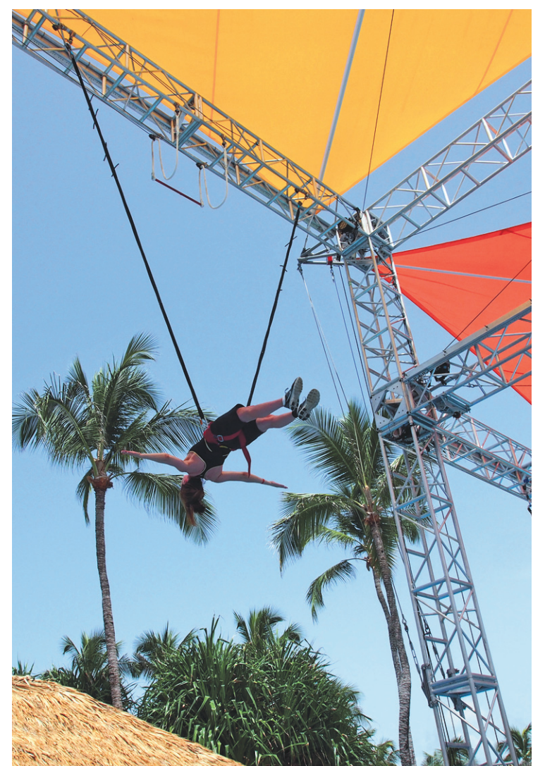
Le bungee est l'une des 25 activités proposées par CREATIFE.