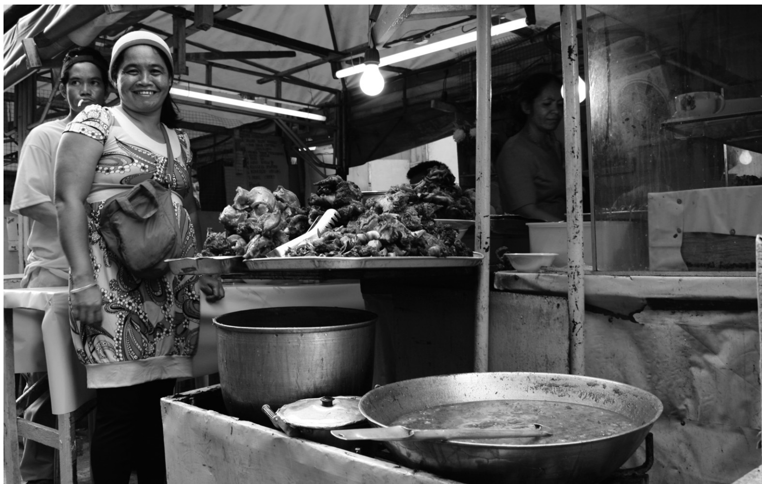
Dans les bouis-bouis philippins, on trouve de tout: du poulet comme des testicules de taureau en ragout! Ci-dessus, visite au Carbon Market de Cebu.

Tout récemment, c'est le haggis écossais (de la panse de brebis farcie de la fressure du mouton — les poumons me poursuivent!), un proche cousin du tablier sapeur (de la panse de bœuf panée) des bouchons lyonnais, qui m'a étonnée, du moins dans sa version gourmet. À Glasgow, ville magnifique dont je vous parlerai la semaine prochaine, impossible de ne pas y goûter: il est aussi présent sur les menus que le sont les vellités d'indépendance du pays dans l'actualité locale. Servi sur un élégant lit de