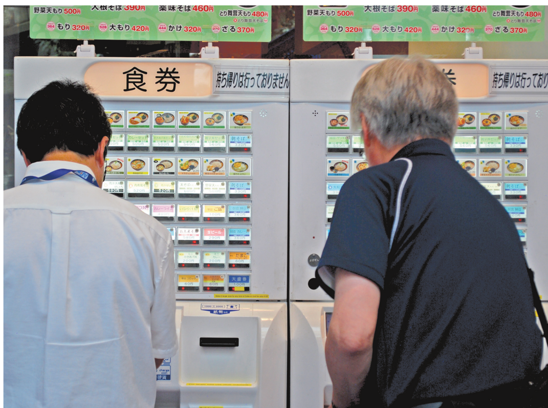
Au Japon, on trouve même des soupes dans les machines distributrices!