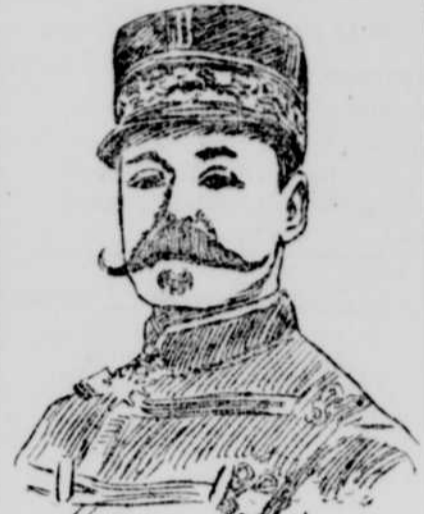
Le général ZURLINDEN, gouverneur militaire de Paris.

Paris, 2.—La confession d'Henry, qui a fabriqué un document sur lequel le général de Pellieux, chef d'état-major de l'armée, s'est appuyé dans son rapport adressé aux jurés du procès de Dreyfus.