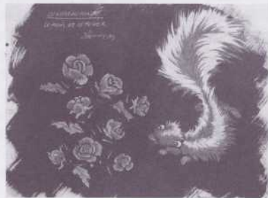
ILLUSTRATION Richard Lacroix