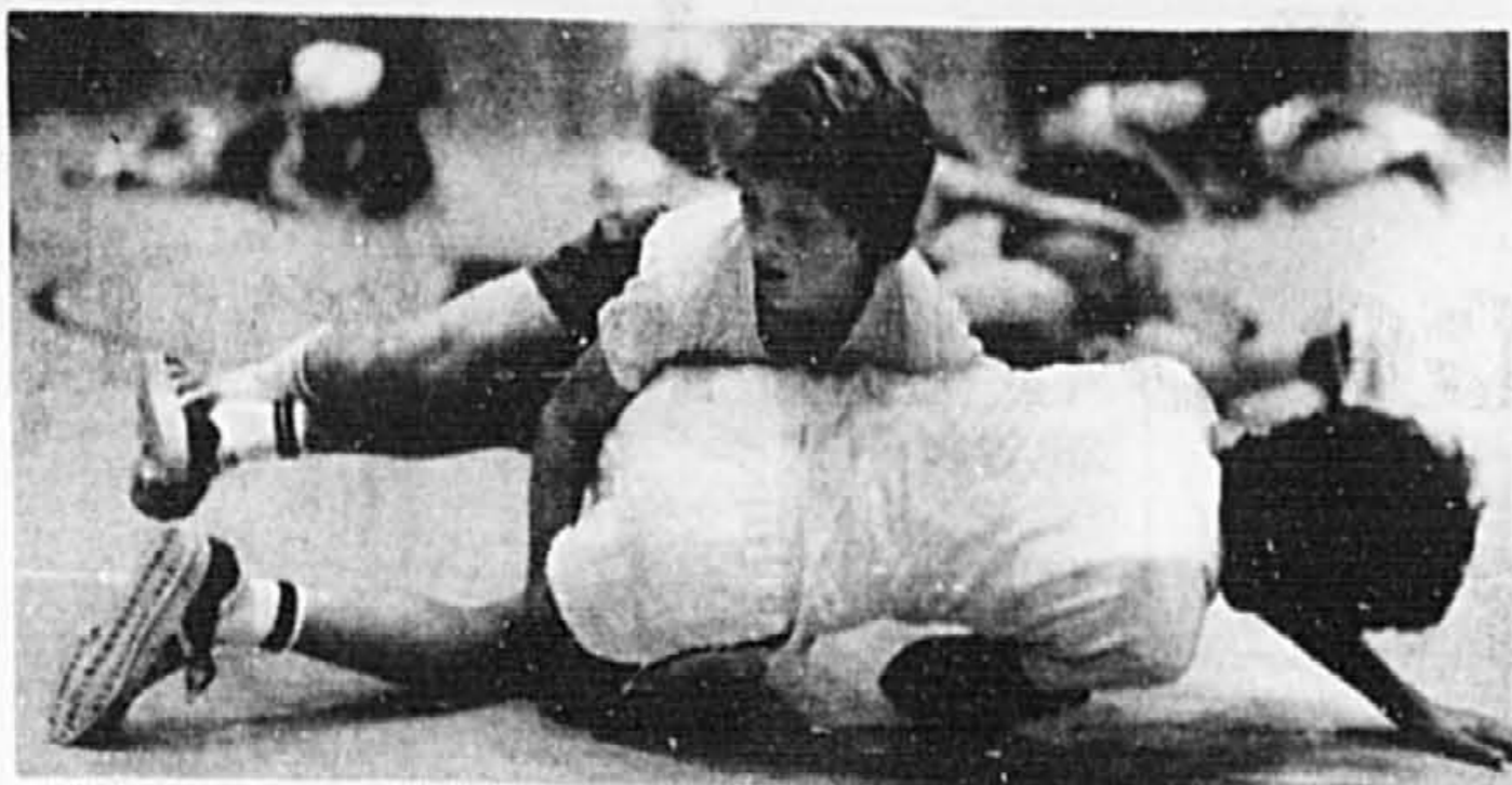
L'important ce n'est pas de gagner, c'est de participer. (Pierre De Coubertin)