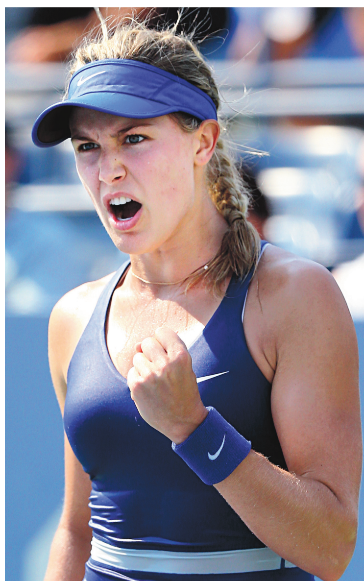
AL BELLO AGENCE FRANCE-PRESSE

«Les tournois majeurs sont les plus importants événements de l'année, ils sont très particu-