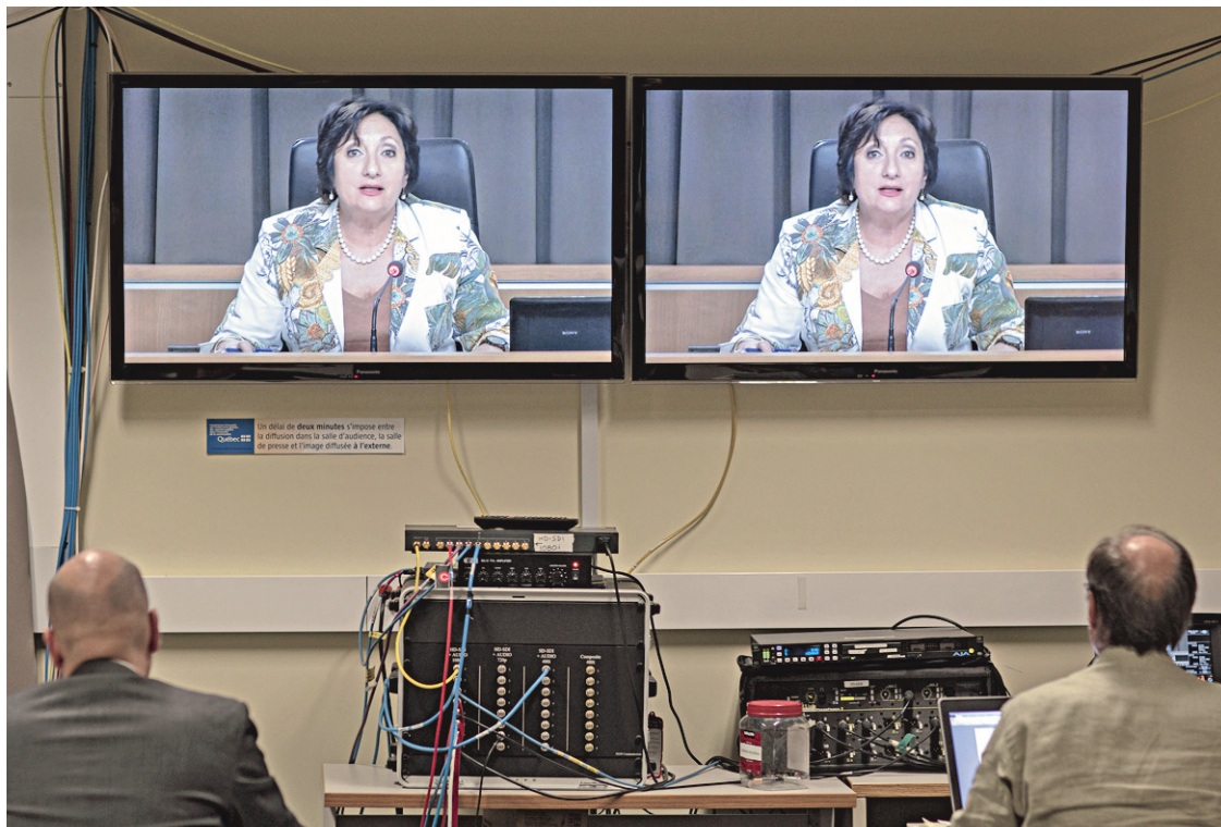
La commission Charbonneau a rendu publics les 70 mémoires qui ont été déposés auprès d'elle.