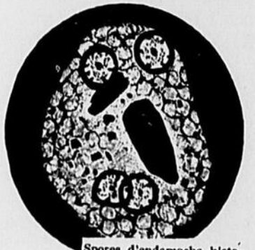
Spores d'endamoeba histolytica (une cause de la dysenterie amidiennne). C'est un des dangereux microbes qui se développent dans les cabinets extérieurs malpropres.