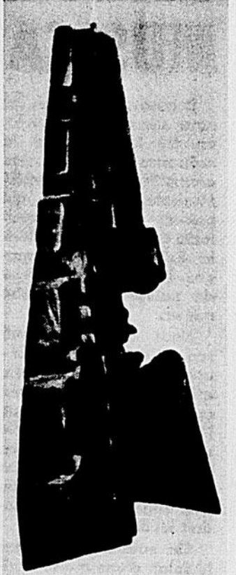
Sculpture "espace no 2", de Jean Noël