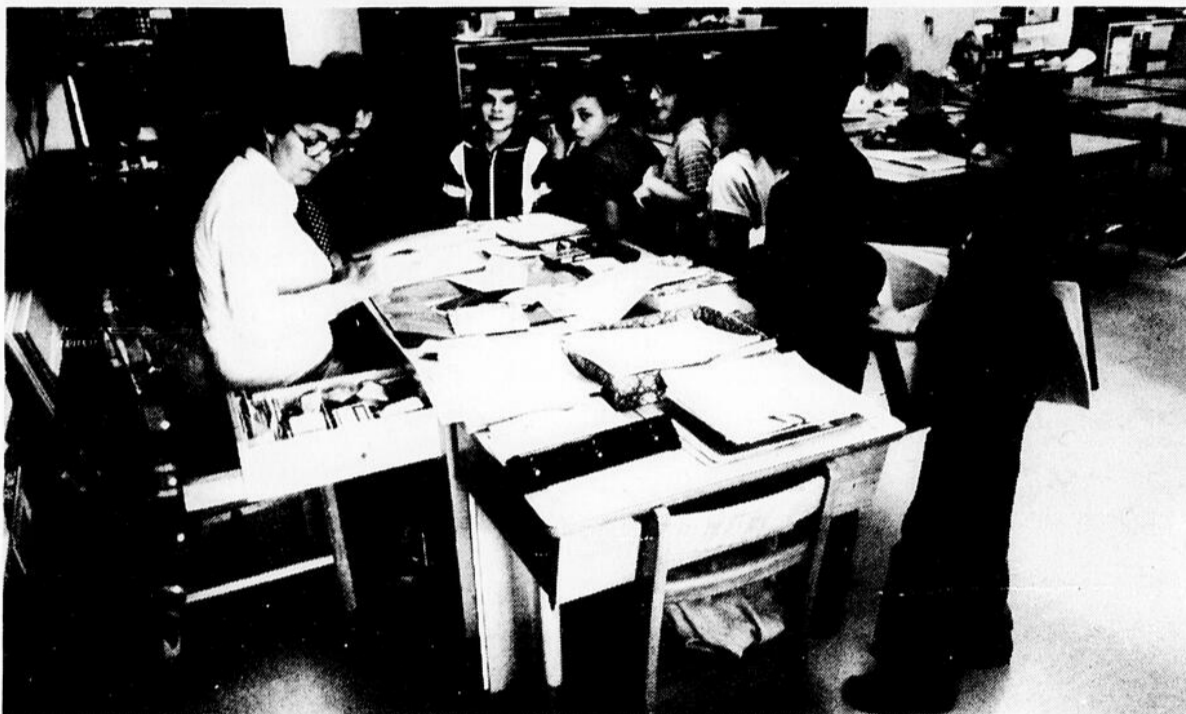
Selon la CEQ, ce n'est ni en coupant dans le personnel de l'enseignement, ni en diminuant les services aux usagers qu'on pourra adapter l'école aux besoins de formation d'aujourd'hui et répondre aux défis économiques et sociaux de demain.