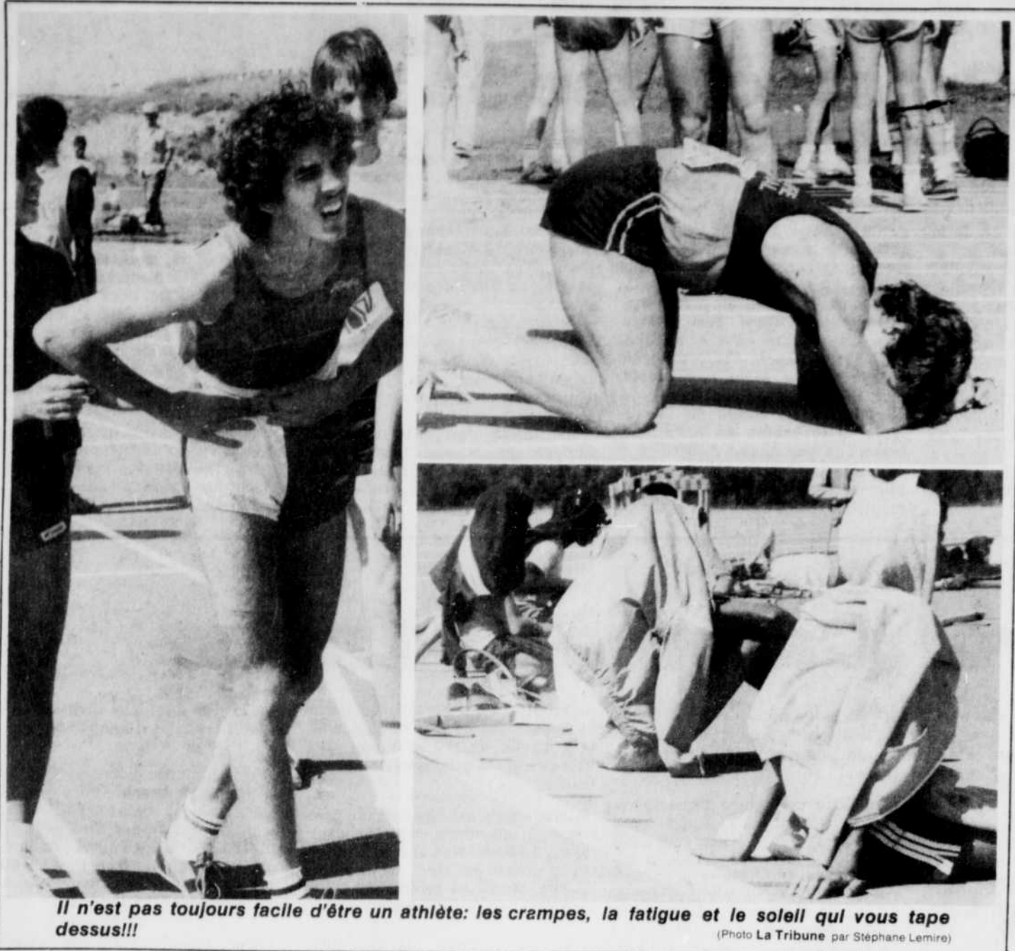
Il n'est pas toujours facile d'être un athlète: les crampes, la fatigue et le soleil qui vous tape dessus!!!