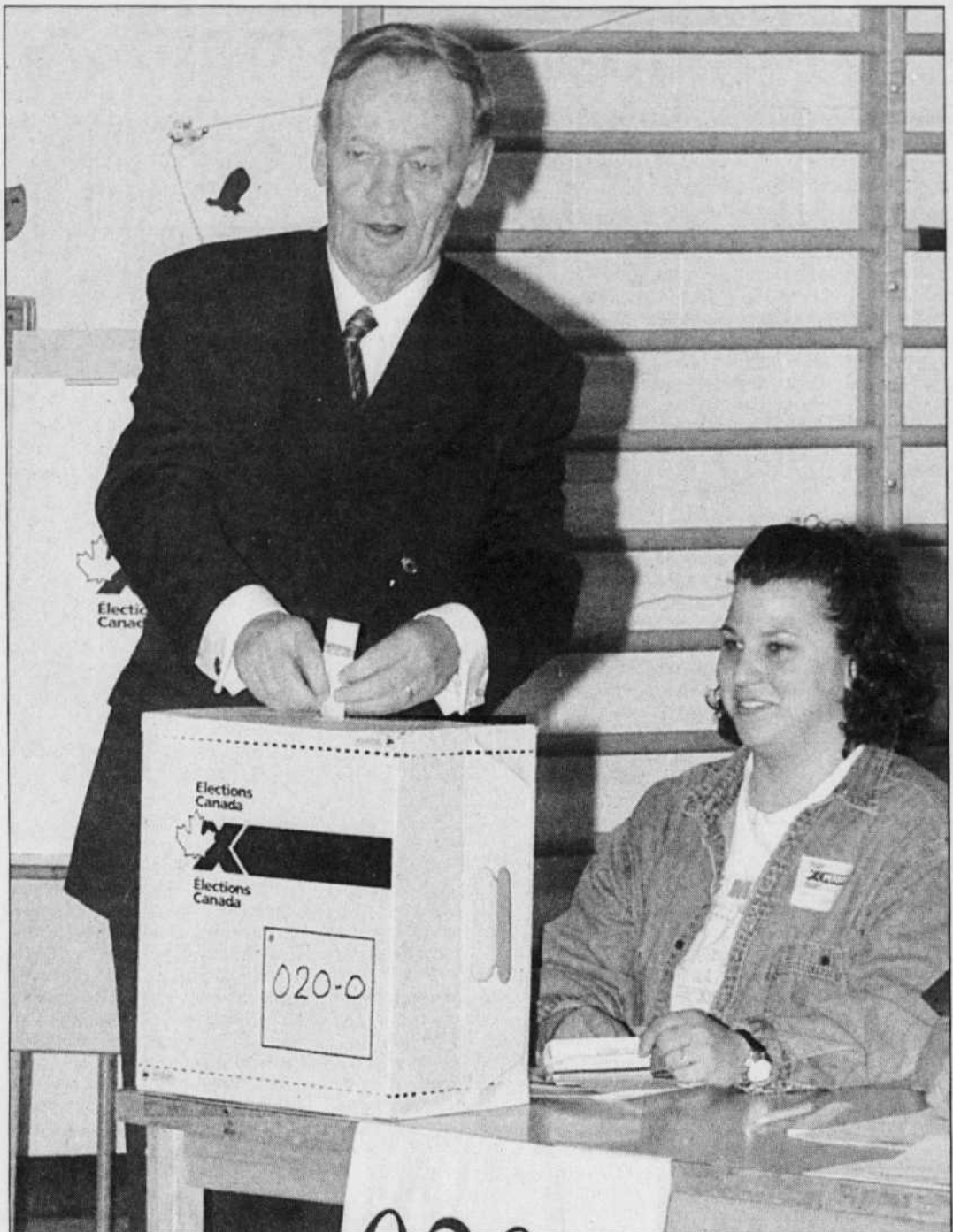
Le premier ministre Jean Chrétien dépose son bulletin de vote dans sa circonscription lors des élections fédérales de 1997.

voie. Si les libéraux restent libres de réformer comme ils l'entendent les règles de leur parti, ils n'ont pas la même liberté à l'égard du régime électoral. Pour qu'elle redonne à la politique fédérale son prestige et la confiance des électeurs, la réforme du système gagne à reposer sur l'assentiment de l'ensemble des députés et des partis présents aux Communes.