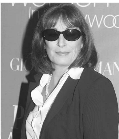
Anjelica Huston compte parmi les signataires d'une lettre qui dénonce l'attitude va-t-en-guerre du gouvernement Bush.

Sextuor à cordes en mi bémol majeur, H. 107 (1906-12) — Bridge