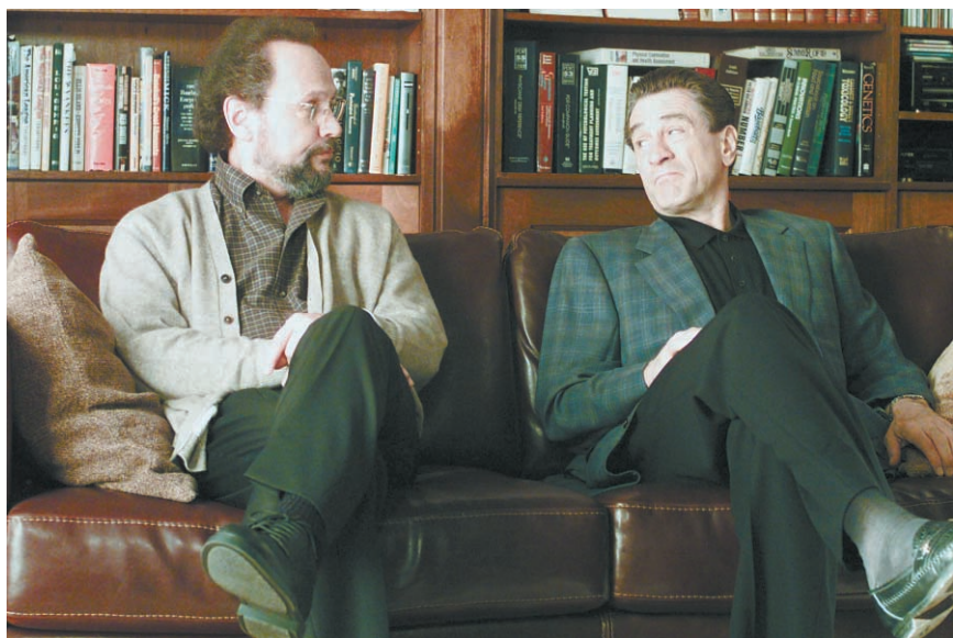
Billy Crystal et Robert De Niro dans une scène de Analyze That .

Crystal: Je n'ai jamais pensé à jouer ce rôle en travesti. Quoique j'ai de plus belles jambes que Lorraine Bracco (la psy de l'émission The Sopranos ).