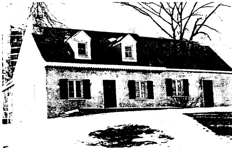
1988 : Après les rénovations de la C.C.N.

Ils avaient laissés derrière eux la pauvreté de la seigneurie de la Petite-Nation de Louis-Joseph Papineau, attirés par la colonie de Wright qui avait une réputation économique enviable.