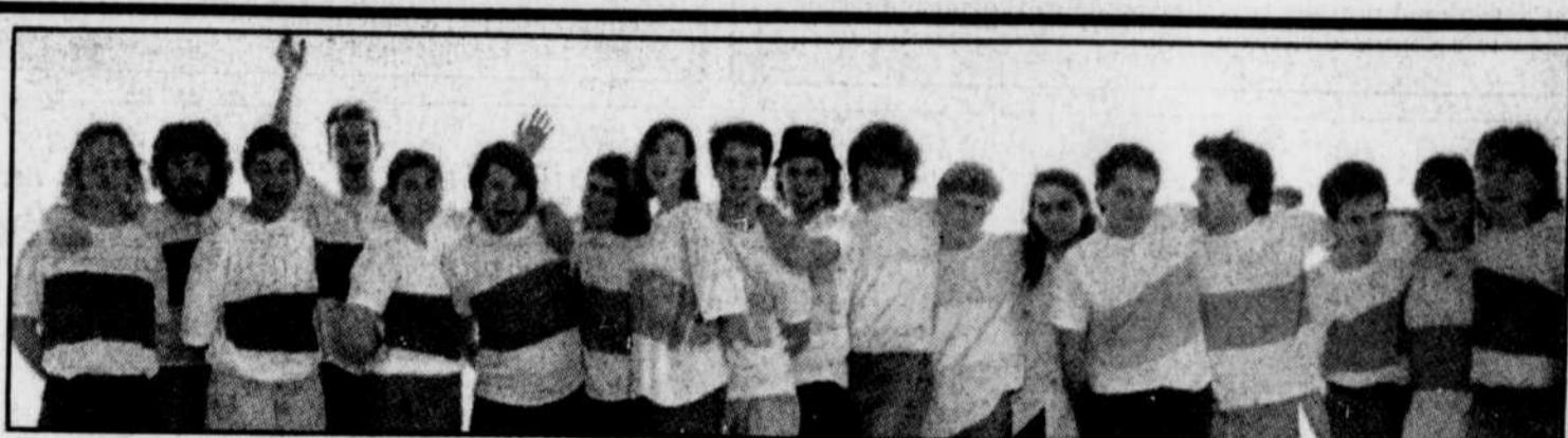
Les finissants en photographie du cégep de Matane.

Quant à la partie de l'assainissement des eaux, qui complètera tout le réseau de Baie-Comeau, le ministère de l'Environnement a donné son accord pour un montant d'environ 5 millions $. Les travaux municipaux sur le réseau d'aqueduc se chiffrent à 2,8 millions $.