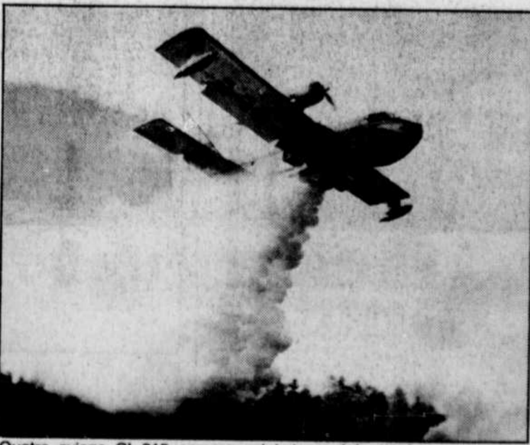
Quatre avions CL-215 comme celui-ci ont été utilisés au cours de l'incendie.

MURDOCHVILLE — Des experts tenteront d'élucider, aujourd'hui, les circonstances d'un incendie qui a ravagé une soixantaine d'hectares de forêt en plein coeur de la péninsule gaspésienne, 25 kilomètres au sud-ouest de Murdochville.