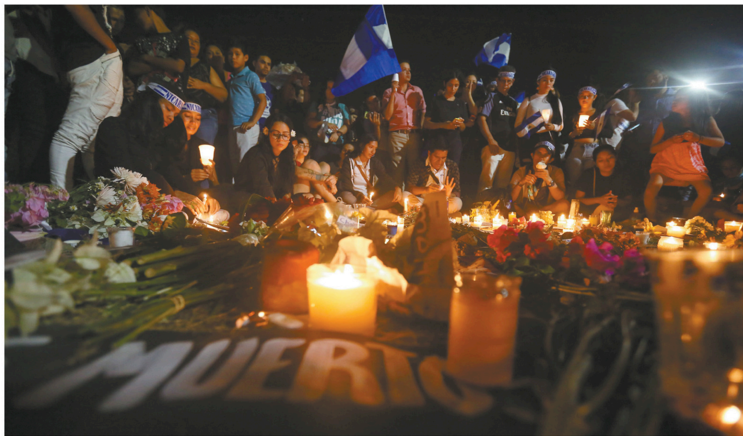
Une veillée aux chandelles, mercredi soir. Le dernier bilan fait état de 34 morts, en majorité des étudiants, en une semaine de manifestations violentes.