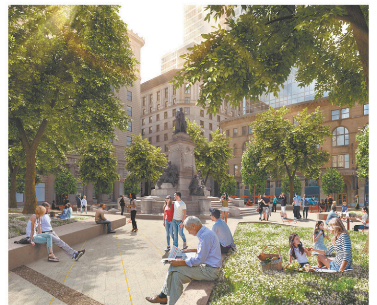
Le projet prévoit la rénovation du square Dorchester cette année et celle du square Phillips (ci-haut) à partir de 2020.