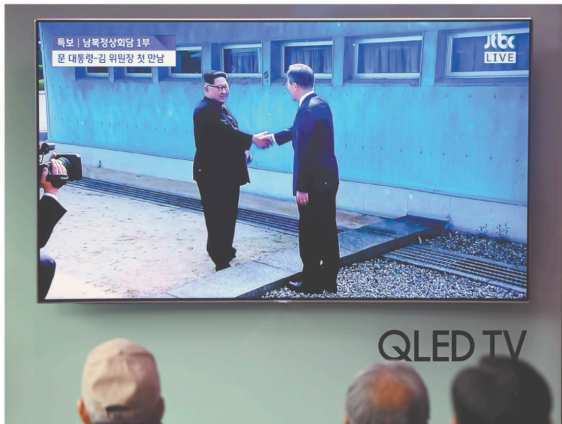
Les dirigeants des deux Corées ont échangé une poignée de main sur la ligne de démarcation, vendredi.