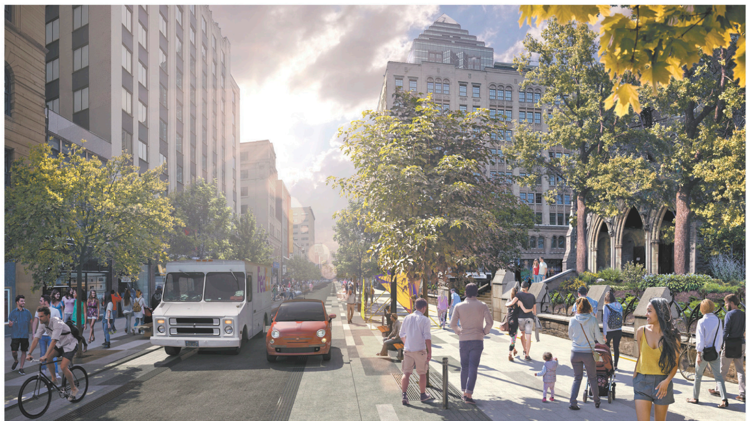
MAQUETTES PROVENCHER ROY

De plus, on estime que 70% des clients des commerces se rendent déjà sur la rue Sainte-