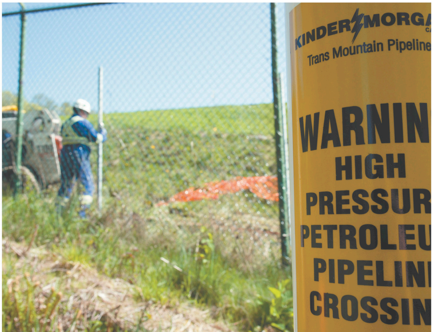
JONATHAN HAYWARD LA PRESSE CANADIENNE

L'expansion du pipeline Trans Mountain ferait passer la capacité quotidienne de transport de 300 000 barils à 890 000 barils.